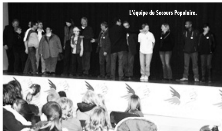
L'équipe du Secours Populaire.