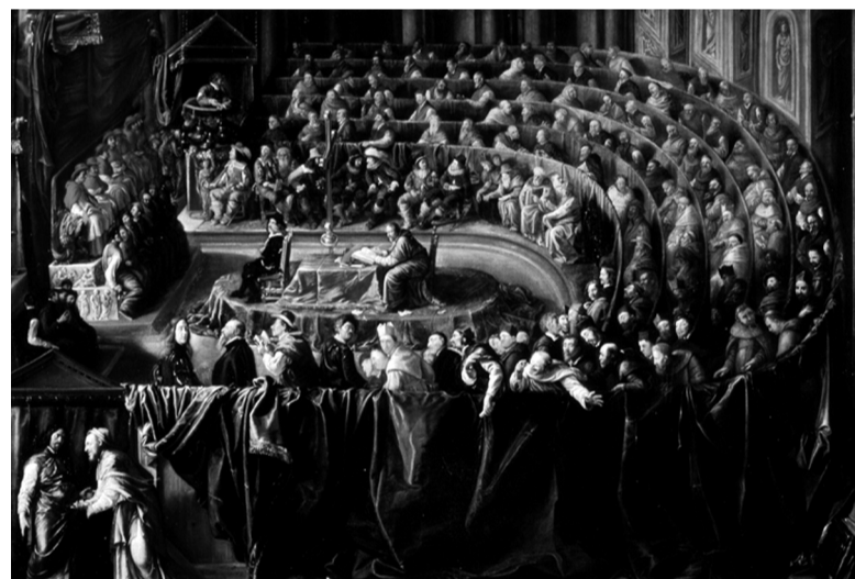
Galilée devant l'Inquisition, à Rome (12 avril-22 juin 1633). Le savant (1564-1642) fut contraint de retirer publiquement les thèses qu'il avançait dans son ouvrage Dialogue sur les deux grands systèmes du monde . Il fut réhabilité par l'Eglise en 1992.

ama09.obspsm.fr et forumdepartementaldessciences.fr