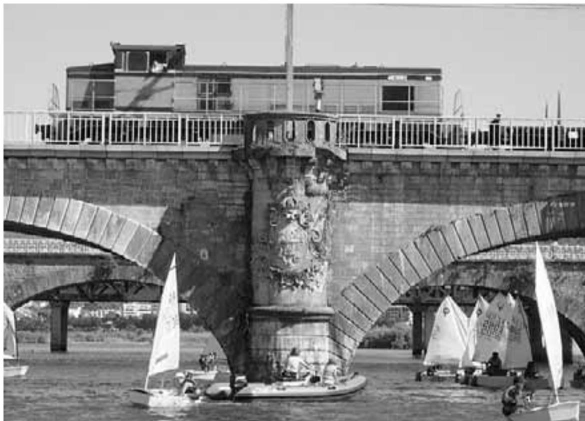
Las imágenes muestran la reciente subida de 40 veleros Optimist por el río Bidasoa hasta el puente de Santiago. En la regata, las pequeñas embarcaciones pasaron bajo los arcos.