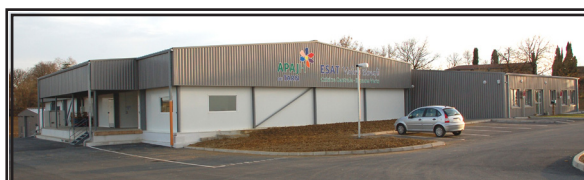
Conception graphique : Service Communication de l'APAJH du Tarn Photos : www.mpvolle.fr - Juillet 2011