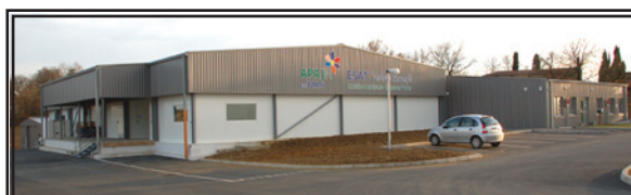
Conception graphique : Service Communication de l'APAJH du Tarn Photos : www.mpvolle.fr - Juillet 2011