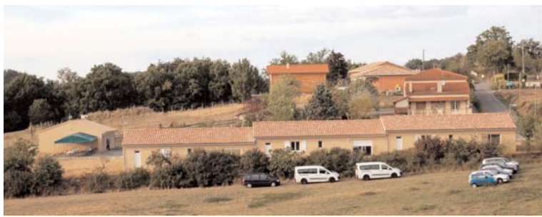
Les 4 maisons du FH, situées « Croix d'Albi » à Réalmont

Thierry Frédéric au micro avec ses collègues du FH et de l'ESAT