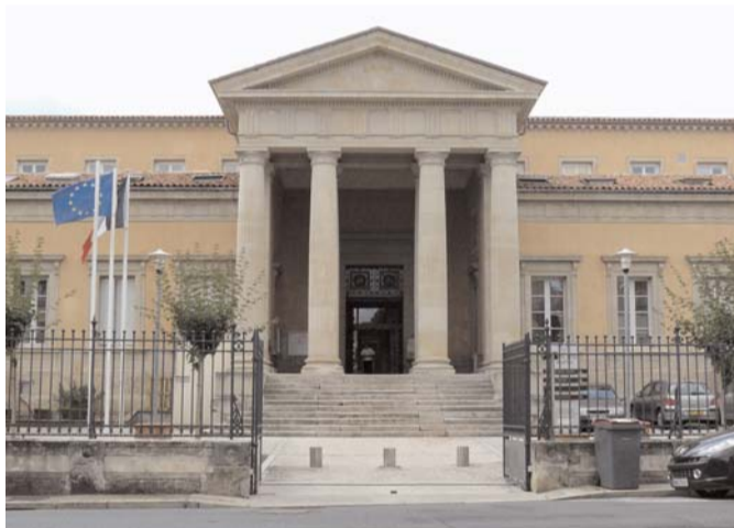
Le Tribunal d'Instance, ici celui de Castres, qui prononce les mesures de protection juridique

Les formateurs sont des professionnels issus du secteur social mais aussi du secteur juridique comme les avocats et les huissiers. A l'issue, le certificat national de compétence est délivré par un jury de professionnels reconnus par le Ministère de la Santé.