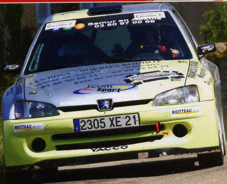
1er scratch pour Etienne Bouhot.