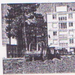
Les tractopelles laisseront bientôt la place au terrain de foot

L'esplanade sera recouverte d'un revêtement solide : un mélange de sable et de fibres synthétiques permettant de potentialiser la durée d'utilisation par rapport à une pe-