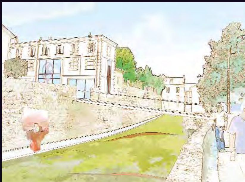
PASSERELLE DES DOUVES (selon Séquences)