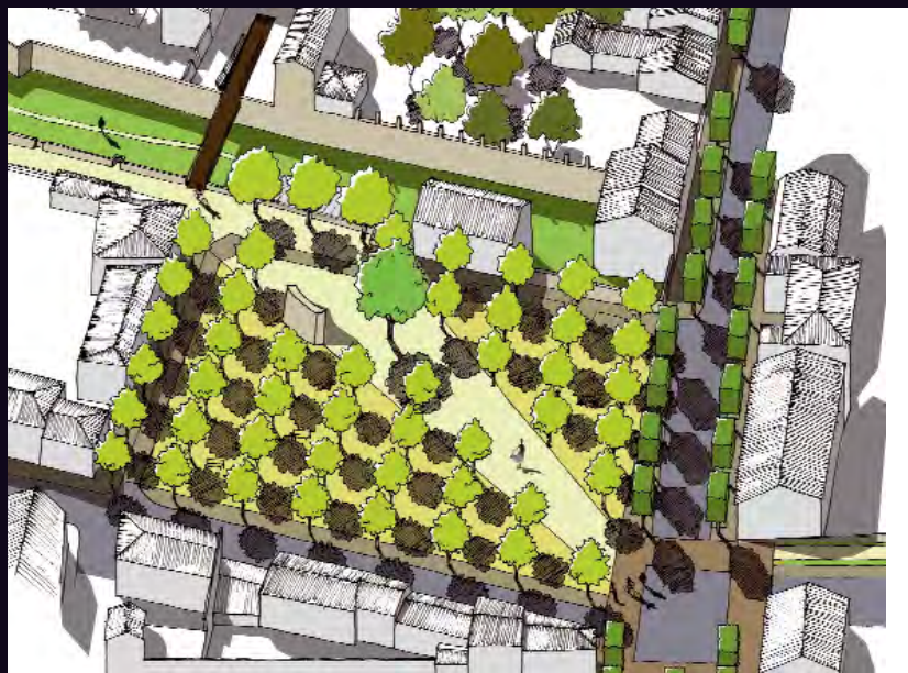
SQUARE DES ANCIENS COMBATTANTS (selon Métaphore)