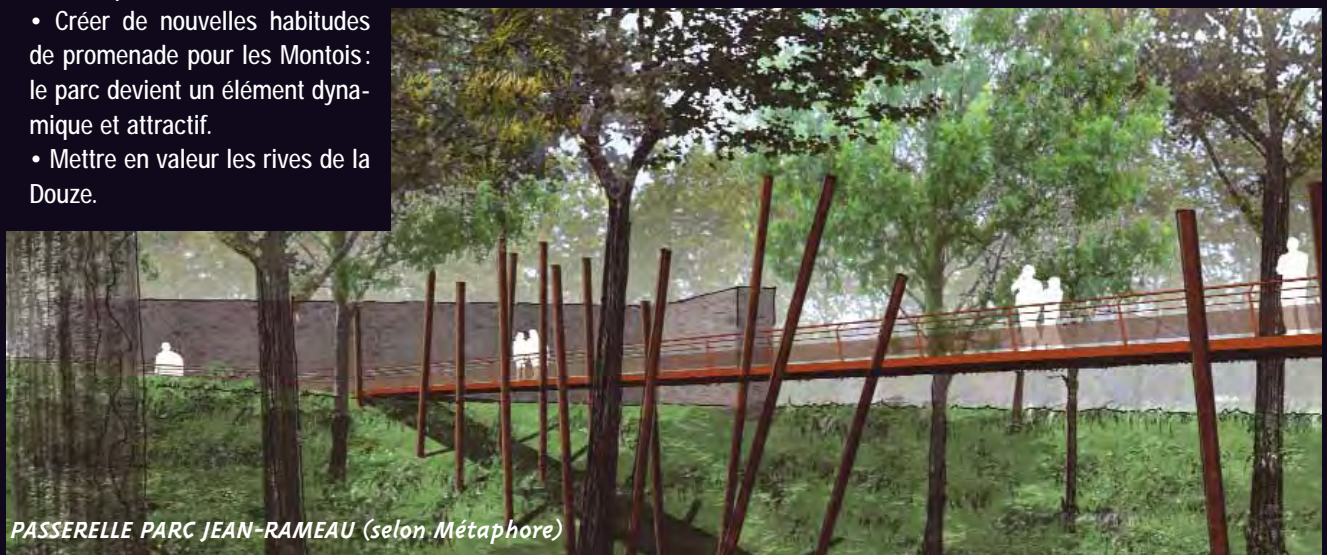
PASSERELLE PARC JEAN-RAMEAU (selon Métaphore)