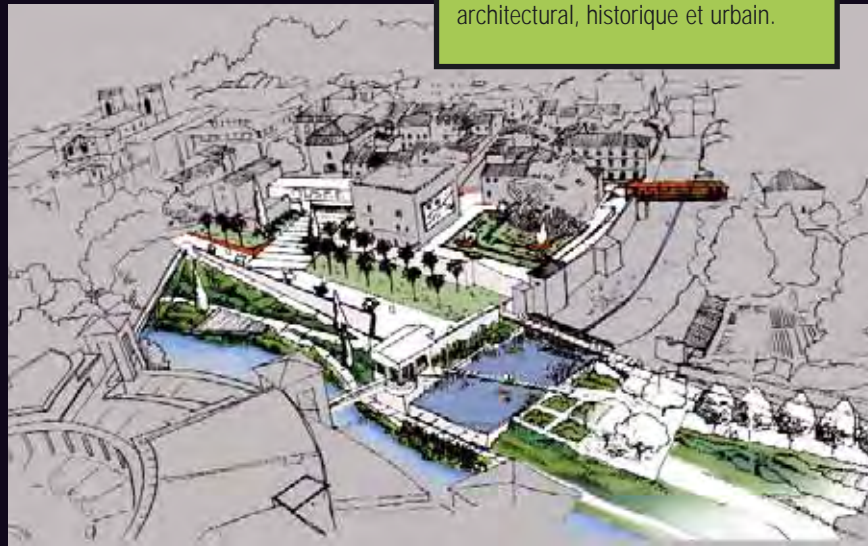
TERRASSES DES MUSÉES (selon Creham)