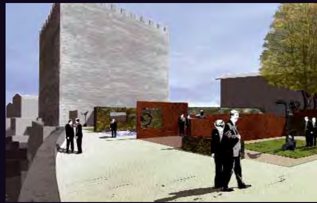
JARDIN INTÉRIEUR [lycée Saint-Vincent] selon Métaphore