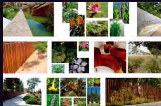
LES AMBIANCES (selon Creham)