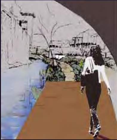
LE PASSAGE SOUS LE PONT DELAMARRE (selon Creham)