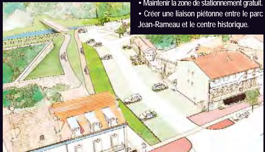
PARKING DE LA DOUZE (selon Séquences)