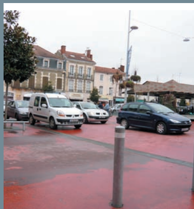
Scène ordinaire en centre ville...