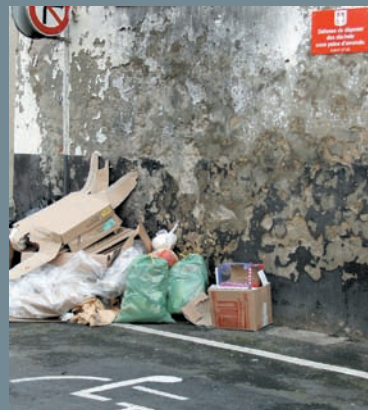
Un dimanche matin parmi d'autres, sur une voie passante jouxtant la mairie.