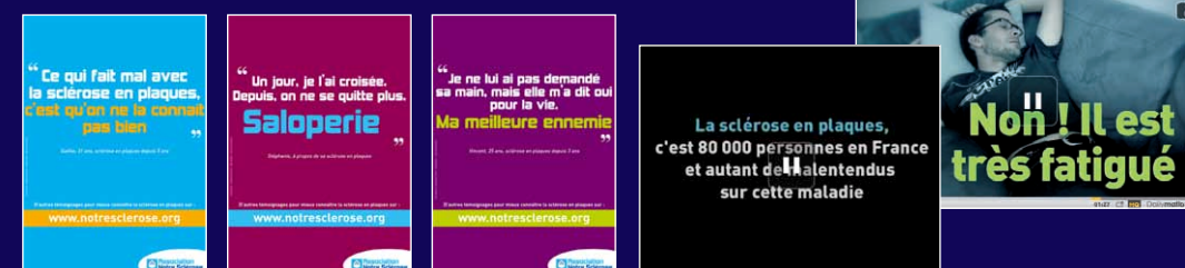
Des affiches et des e-mailings