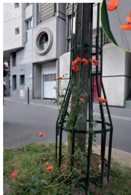
Coquelicot, ou pavot rouge, rue des Pyrénées.

Et à 20h30, dégustation de miels du 20 e .