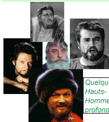
Quelques Hauts-Hommes profonds..