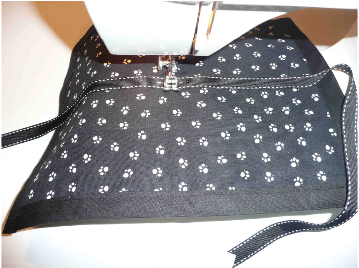
Accrocher grigri ou autre dans l'anneau de la fermeture éclair.....