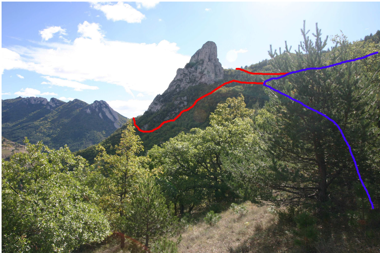
En Bleu le tracé du sentier, en rouge le tracé des sentes.