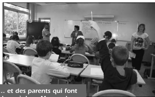
... et des parents qui font classe à Jean Mermoz !

Maternelle de Ruaudin et classe passerelle en 2010, élémentaire de Ruaudin, Antonio Vivaldi et Dr Calmette en 2011 : pas moins de cinq fermetures de classes en seulement une année. Nous pensions que l'hémorragie allait s'arrêter là ! Aussi qu'elle n'a pas été notre surprise d'apprendre deux jours après la rentrée, qu'il y aurait également des fermetures de classes dans les écoles Eugénie Cotton et Jean Mermoz. Finalement, la mobilisation et la détermination des parents d'élèves de l'école Jean Mermoz soutenus par les enseignants et les élus a permis le maintien d'une neuvième classe dans l'école après une semaine de lutte.