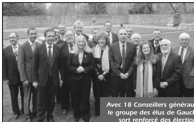
Avec 18 Conseillers généraux, le groupe des élus de Gauche sort renforcé des élections

✉ Hôtel de Ville 72039 Le Mans cedex 9 ch.counil@wanadoo.fr