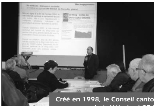
Créé en 1998, le Conseil cantonal s'est déjà réuni 35 fois