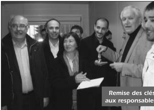
Remise des clés du local aux responsables du club

Au début du printemps, nous avons rendez-vous au complexe sportif des Sources pour l'inauguration du local destiné à l'US Glonnières.