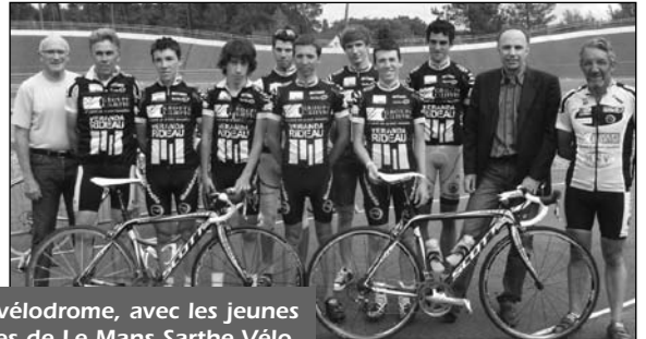
Au vélodrome, avec les jeunes cyclistes de Le Mans Sarthe Vélo.

Parmi les subventions les plus importantes, on peut citer une aide de 1 635 € à l'association Da Capo 72 pour permettre l'achat de matériel destiné aux jeunes magiciens de cette école de magie ou encore une aide de 3 740 € au Club Le Mans Sarthe Vélo pour l'acquisition de deux vélos destinés à l'école de cyclisme.