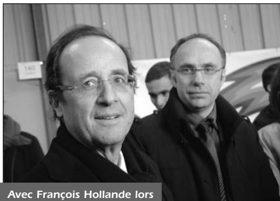
Avec François Hollande lors des élections cantonales

Dans notre canton, deux bureaux de vote seront à votre disposition :