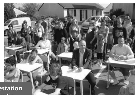
Manifestation à Ruaudin...