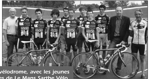
Au vélodrome, avec les jeunes cyclistes de Le Mans Sarthe Vélo.

Parmi les subventions les plus importantes, on peut citer une aide de 1 635 € à l'association Da Capo 72 pour permettre l'achat de matériel destiné aux jeunes magiciens de cette école de magie ou encore une aide de 3 740 € au Club Le Mans Sarthe Vélo pour l'acquisition de deux vélos destinés à l'école de cyclisme.