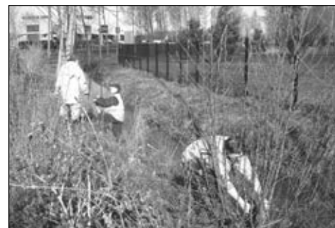
Les salariés du chantier d'insertion cantonal à l'œuvre aux abords de Family Village