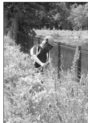
L'action des Chantiers d'insertion du canton examinée par les membres du Conseil cantonal

Enfin le 11 juin, en présence des responsables des chantiers d'insertion du canton, nous nous sommes penchés sur les politiques d'insertion à l'occasion de la mise en œuvre du Revenu de Solidarité Active amené à remplacer le RMI et l'API.