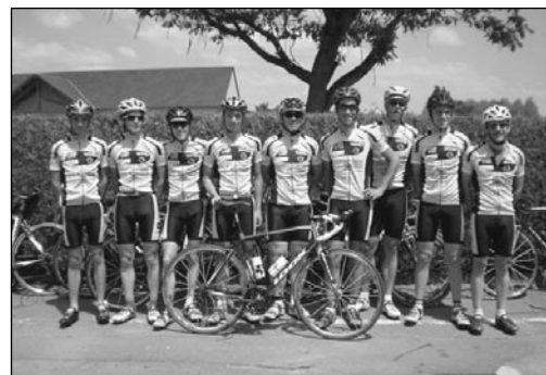
Présentation du nouveau matériel de l'équipe Juniors Le Mans Sarthe Vélo

Pour plus de renseignements, sur les modalités d'obtention d'une aide pour votre projet d'équipement, vous pouvez contacter le 02 43 54 74 79.