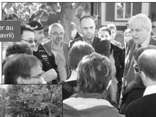
Visite de quartier au Vert Galant (20 avril)

Lors de chaque visite, je suis systématiquement interpellé sur le même type de questions : les problèmes de tranquillité publique, la question de la propreté et enfin le sujet non moins compliqué de la circulation et du stationnement. Ces exemples montrent combien il devient compliqué de vivre en société quand quelques personnes ne respectent plus les règles du savoir vivre ensemble... cela doit d'ailleurs renvoyer chacun d'entre nous à sa propre attitude.