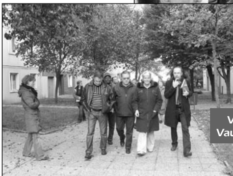
Visite de quartier à Vauguyon (25 octobre)