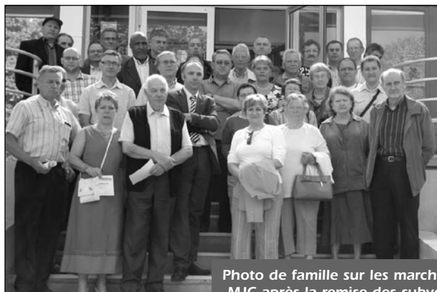
Photo de famille sur les marches de la MJC après la remise des subventions

Par ailleurs, 12 554 € ont été attribués aux projets culturels portés par 33 associations dont 5 nouvelles :