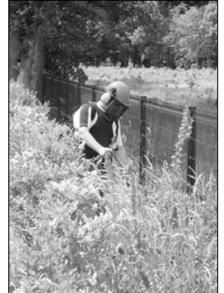
L'action des Chantiers d'insertion du canton examinée par les membres du Conseil cantonal

Enfin le 11 juin, en présence des responsables des chantiers d'insertion du canton, nous nous sommes penchés sur les politiques d'insertion à l'occasion de la mise en œuvre du Revenu de Solidarité Active amené à remplacer le RMI et l'API.