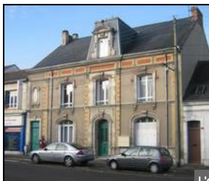
L'espace associatif "Droits des femmes" avenue Félix Genesaly

Espace associatif et solidaire Philippe Goude (place des Comtes du Maine) Logements associatifs de la rue de Turquie Pôle associatif Coluche ( Ronceray) Espace associatif Droit des femmes (Pontlieue)