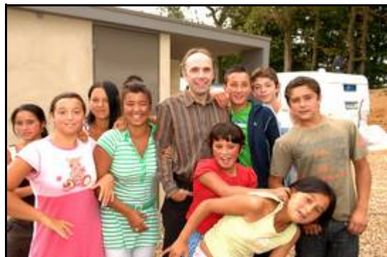
Lors de l'inauguration du terrain de stationnement d'Yvré l'Évêque