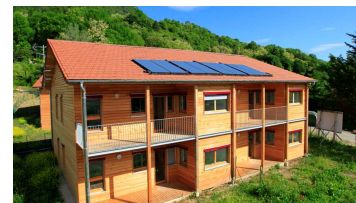
Commune de la TERRASSE - logements sociaux (architecture passive)

Claix est la commune qui a l'objectif d'accroissement le moins important de l'agglomération. (Varces 55,6% - Sassenage 50,6% - Seyssins 44,3% ... Claix 21%).