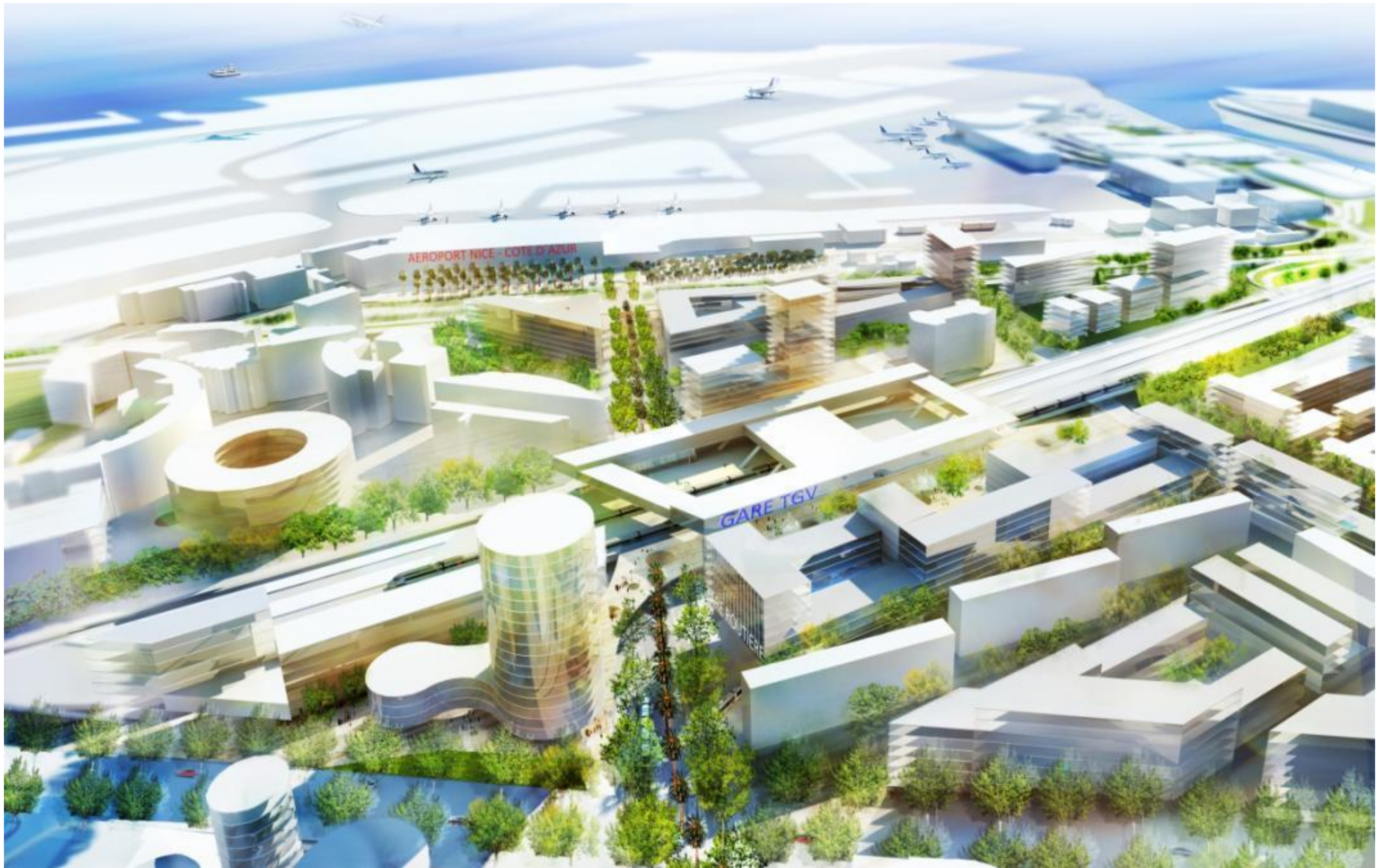
Figure 3 Perspectives du Grand Arénas depuis la route de Grenoble - Visuel MateoArquitectura (2012)