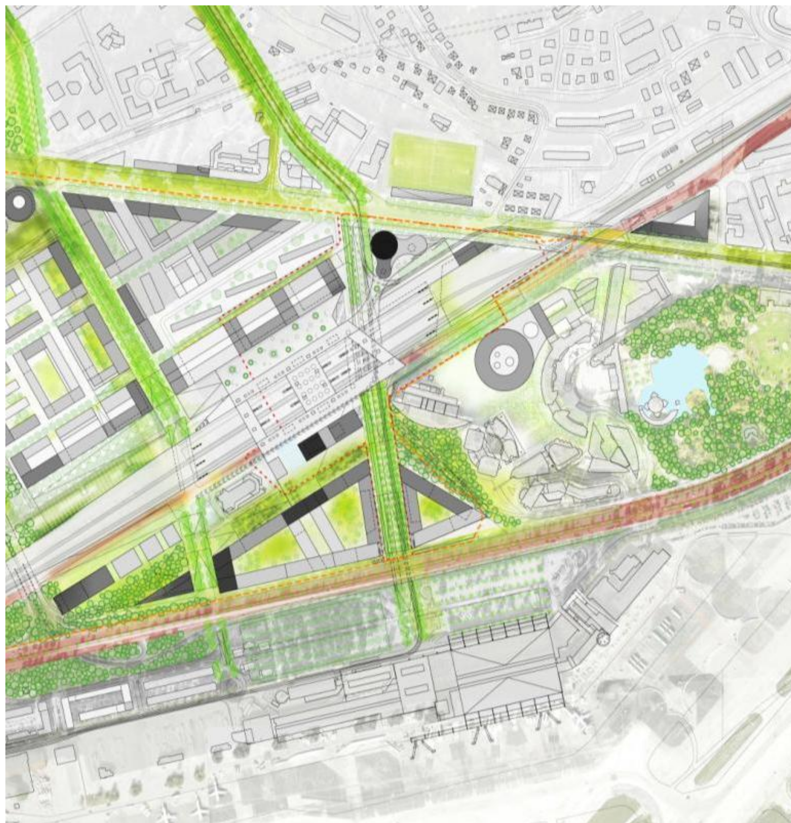
Figure 1 Espaces publics du pole d'échanges multimodal - visuel MateoArquitectura (2012)