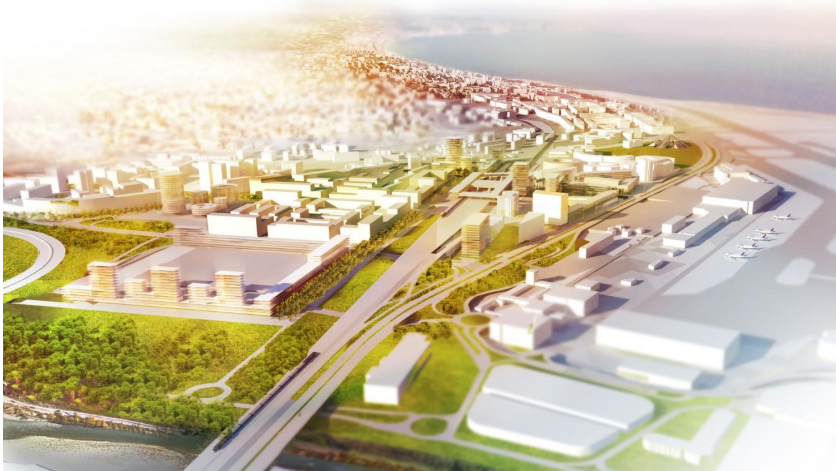
Figure 2 Perspectives du Grand Arénas depuis le Var - Visuel MateoArquitectura (2012)