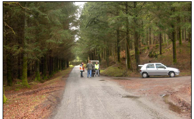
Au bout de la digue de l'étang de la Voûte, le trail partait à droite, plein sud vers l'étang de Condeau....