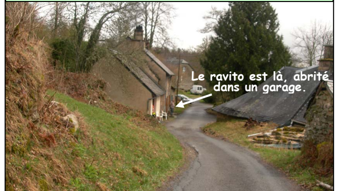
Le ravito est là, abrité dans un garage.