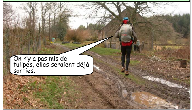
On n'y a pas mis de tulipes, elles seraient déjà sorties.