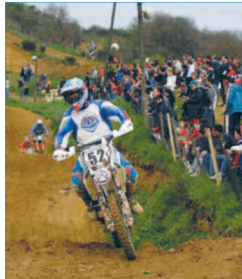
Le spectacle était au rendez-vous de cette nouvelle édition du moto-cross audois, comptant pour les championnats de ligue.