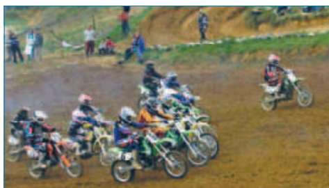
La pluie des derniers jours et le soleil dominical ont permis au terrain d'être ni trop boueux ni trop poussiéreux.