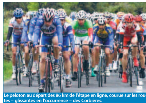
Le peloton au départ des 86 km de l'étape en ligne, course sur les routes - glissantes en l'occurrence - des Corbières.