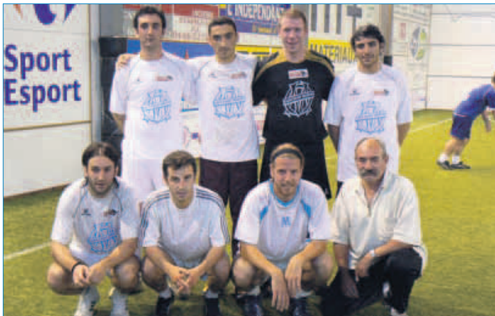
Les équipiers du Café Saint-Martin n'ont laissé aucune chance à leur adversaire lundi soir.

PLEISPORT CUP, demi-finales. Solides vainqueurs de Eurodis Sud - ERA Immobilier, les Perpignanais du Café Saint-Martin-Objectif Eau peuvent toujours atteindre leur but : gagner la coupe. En finale, lundi soir, ils retrouveront l'Escale Portugaise qui réussira le doublé en cas de succès.