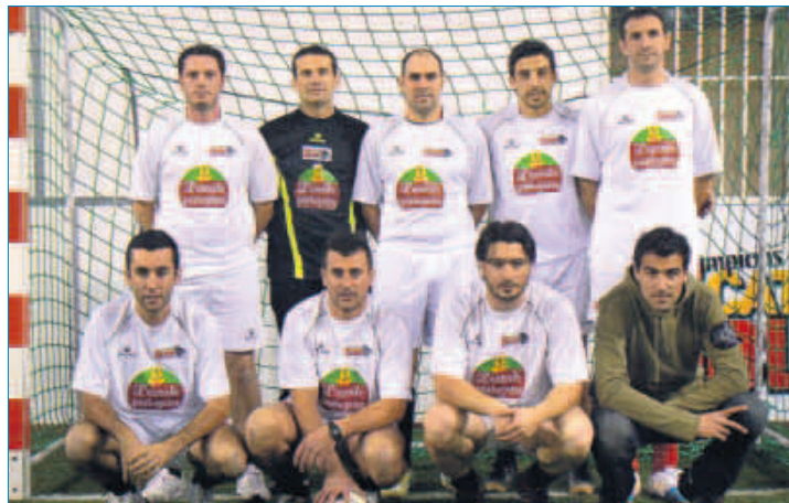
Les Perpignanais de l'Escale Portugaise sont en route pour le doublé coupe-championnat.