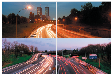
extrait du livre