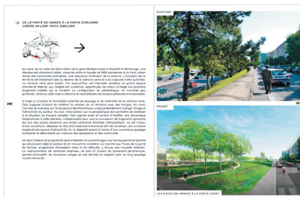
extrait du livre