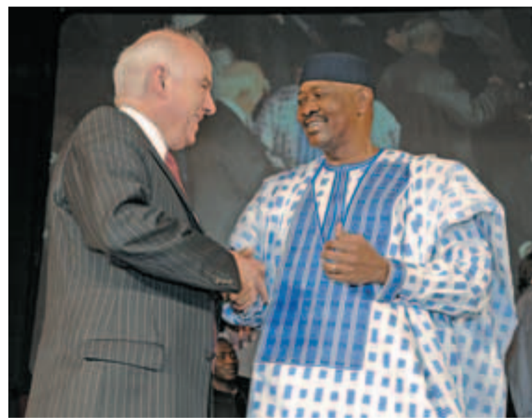
Le maire de Montreuil a accueilli le président de la République malienne dans la salle des fêtes.

« On m'avait proposé une salle plus grande; j'ai préféré joindre mes compatriotes à Montreuil, a-t-il expliqué. Vous savez, le Mali n'est pas pauvre, M. le député-maire. Nous ne sommes pas venus en France pour mendier. Nous ne sommes pas venus pour faire la manche. Nous sommes venus pour travailler. Notre richesse, ce sont ces hommes et ces femmes que vous voyez. La richesse n'est pas seulement monétaire. La richesse, c'est d'abord la dignité, c'est l'honneur, c'est la parole que l'on donne. Et le respect de