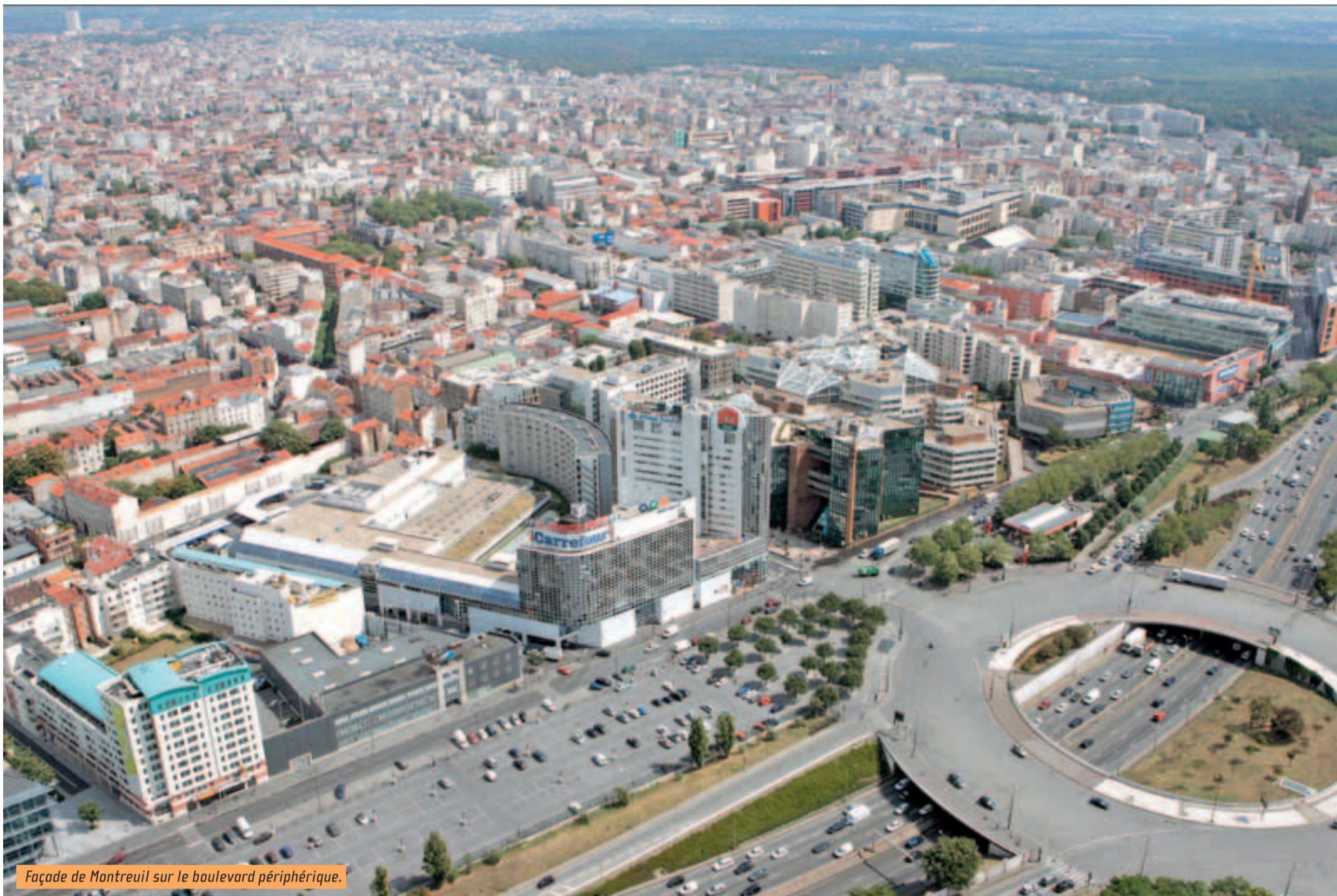
Façade de Montreuil sur le boulevard périphérique.

municipalité et concernent le Bas-Montreuil. L'équipe Pranas-Descours propose ainsi de déplacer le marché aux puces sur le terre-plein central de l'actuel rond-point de la Porte de Montreuil, d'en améliorer sa gestion et de créer une halle pour les brocanteurs. La création d'un parking souterrain de 500 places est envisagée. Montreuil doit harmoniser ses tarifs de stationnement avec Paris : actuellement, les Parisiens utilisent les places de stationnement, moins chères, à Montreuil. La station-service avenue Léon-Gaumont devrait descendre au niveau du périphérique. Les Villes de Paris, Montreuil et Bagnolet souhaitent une pratique intercommunale pour les services de voirie et de police.