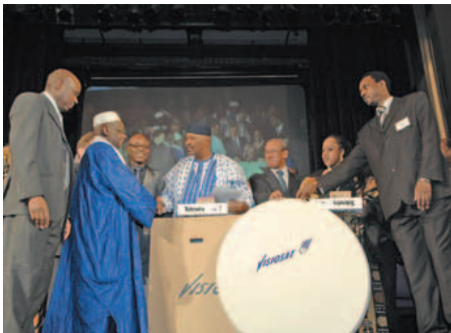
À l'occasion de sa venue à Montreuil, le président de la République malienne a lancé la nouvelle télévision malienne par satellite, l'ORTM.