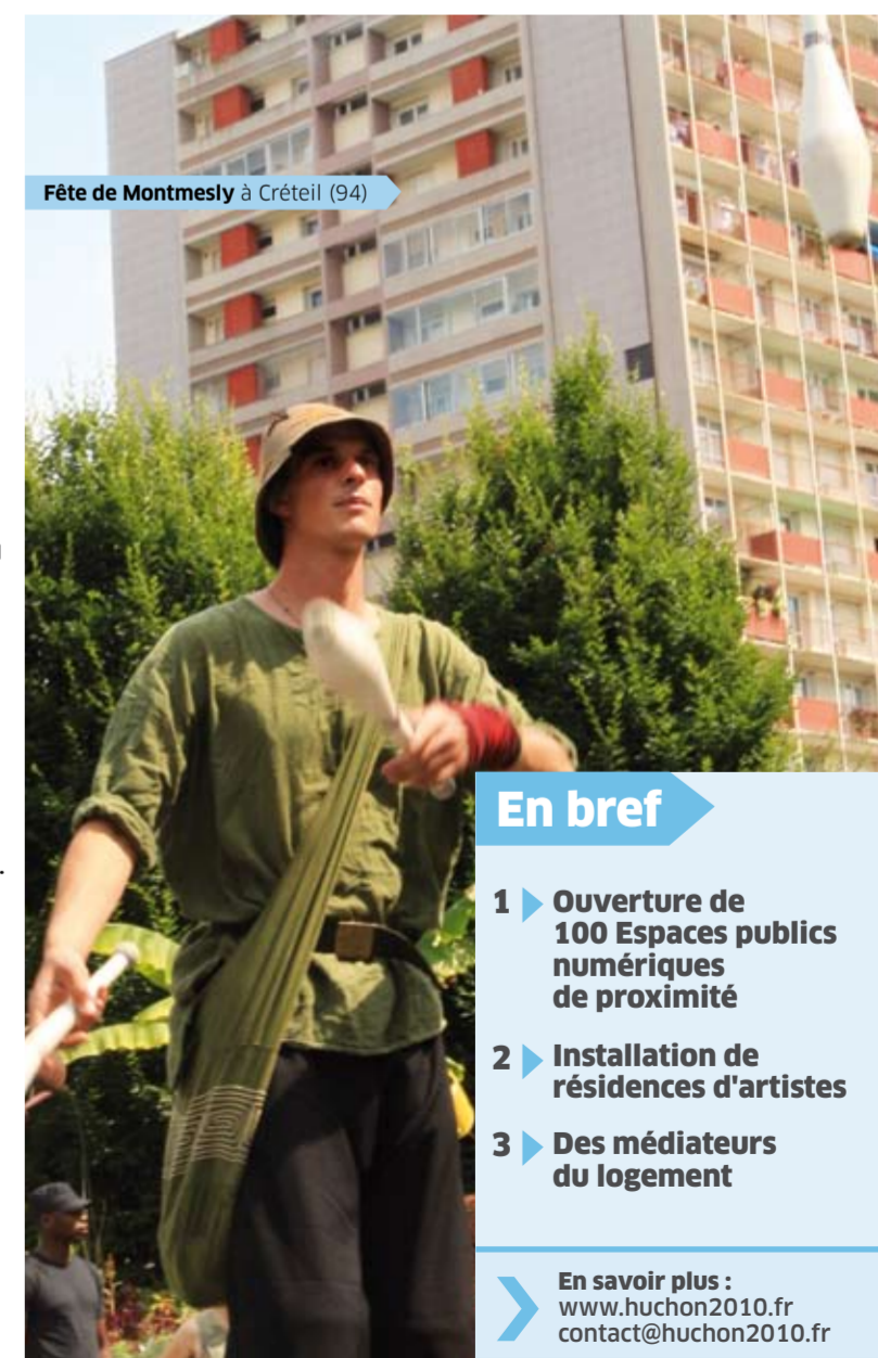
Fête de Montmesly à Créteil (94)

Ce dynamisme ne saurait faire oublier les problèmes économiques rencontrés par les habitants, leur éloignement des