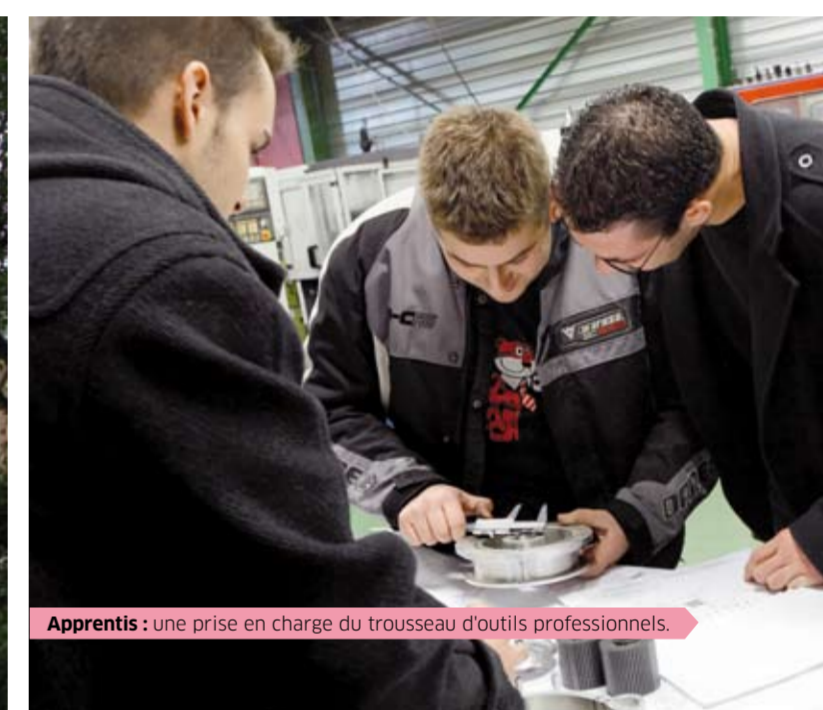
Apprentis : une prise en charge du trousseau d'outils professionnels.