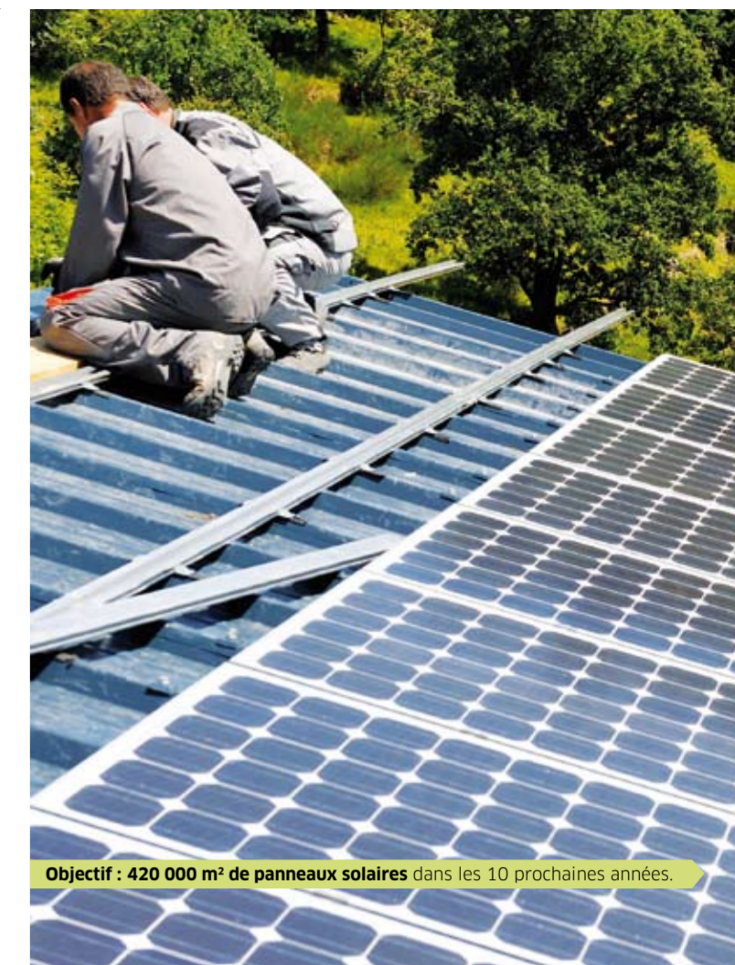
Objectif : 420 000 m 2 de panneaux solaires dans les 10 prochaines années.

En savoir plus : www.huchon2010.fr contact@huchon2010.fr