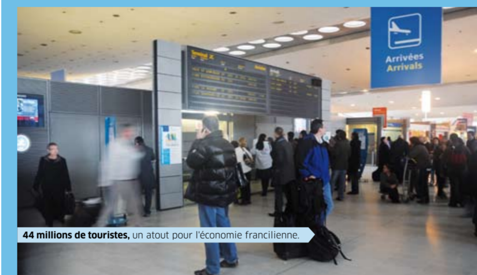
44 millions de touristes, un atout pour l'économie francilienne.