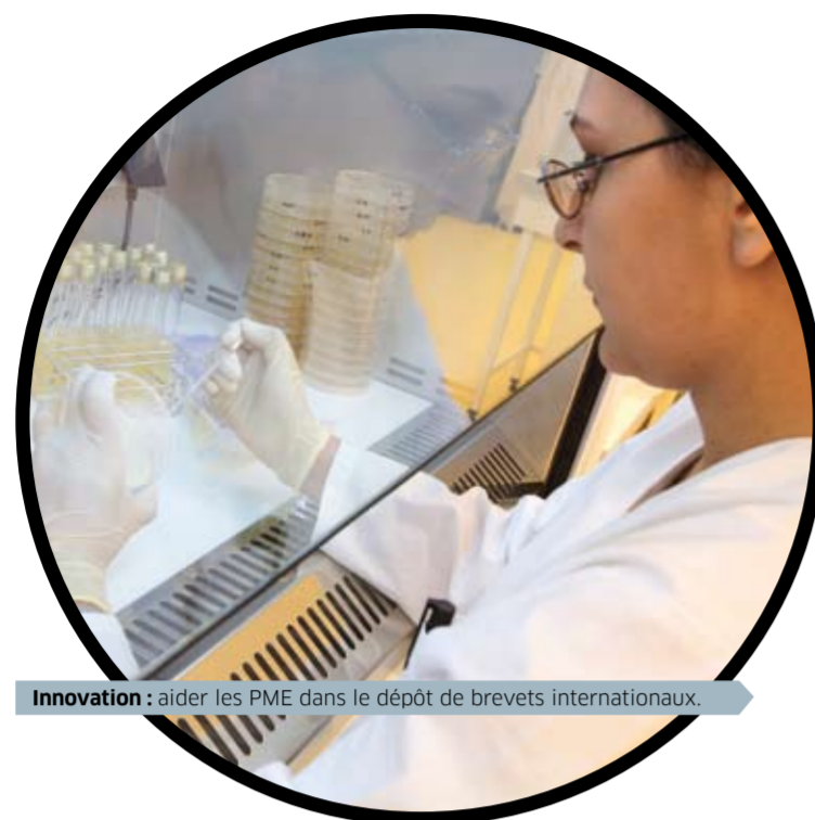
Innovation : aider les PME dans le dépôt de brevets internationaux.

PME / Création, développement, transmission. La Région, partenaire de l'initiative économique