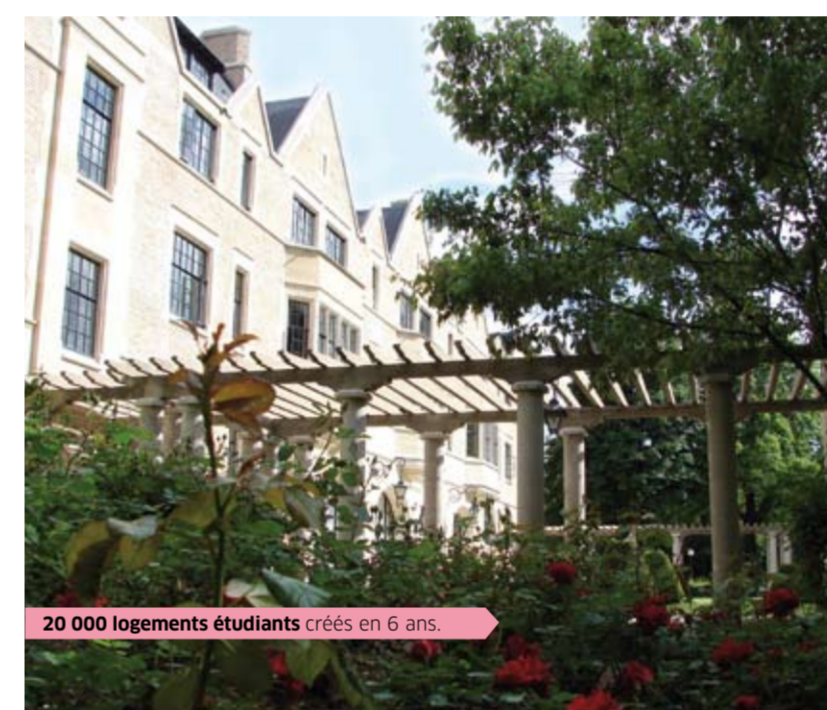
20 000 logements étudiants créés en 6 ans.

En savoir plus : www.huchon2010.fr contact@huchon2010.fr