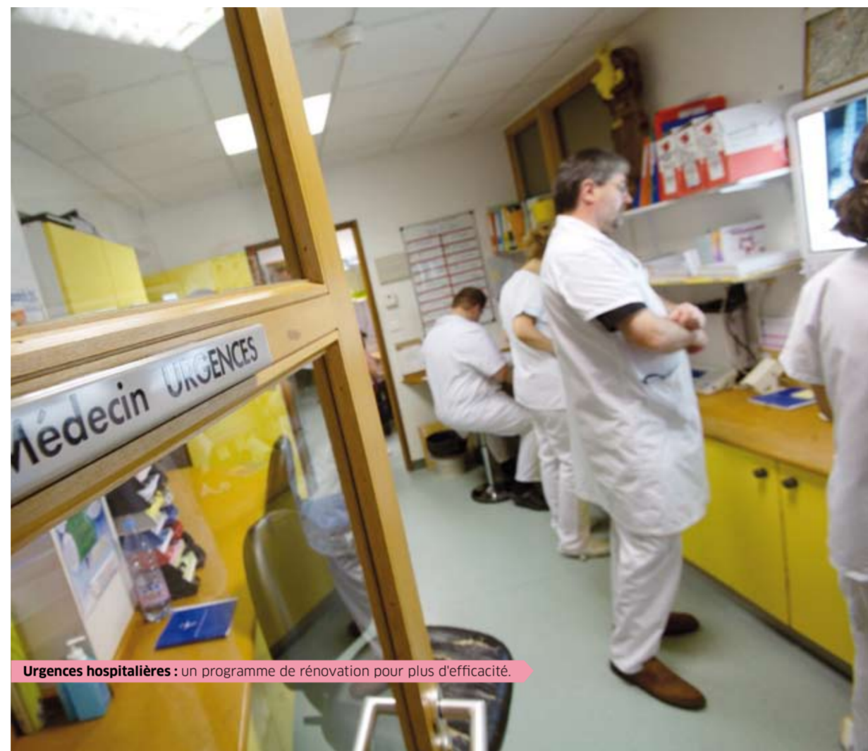
Urgences hospitalières : un programme de rénovation pour plus d'efficacité.

Plus de 100 communes franciliennes manquent de personnels de santé (médecins, infirmières, psychologues, etc.). Pour lutter contre cette inégalité dans l'accès aux soins, la Région Île-de-France proposera des Contrats RéciproSanté offrant une aide financière à la scolarité des étudiant-e-s en médecine ou en formations sanitaires et sociales souhaitant exercer ou accomplir des stages dans ces zones sous-équipées. Elle participera à l'ouverture de maisons pluridisciplinaires et à l'installation de centres de santé, qui pratiquent le tiers-payant de secteur 1 et qui offrent une facilité d'accès à la consultation, un large éventail de spécialités et des plateaux techniques étendus.