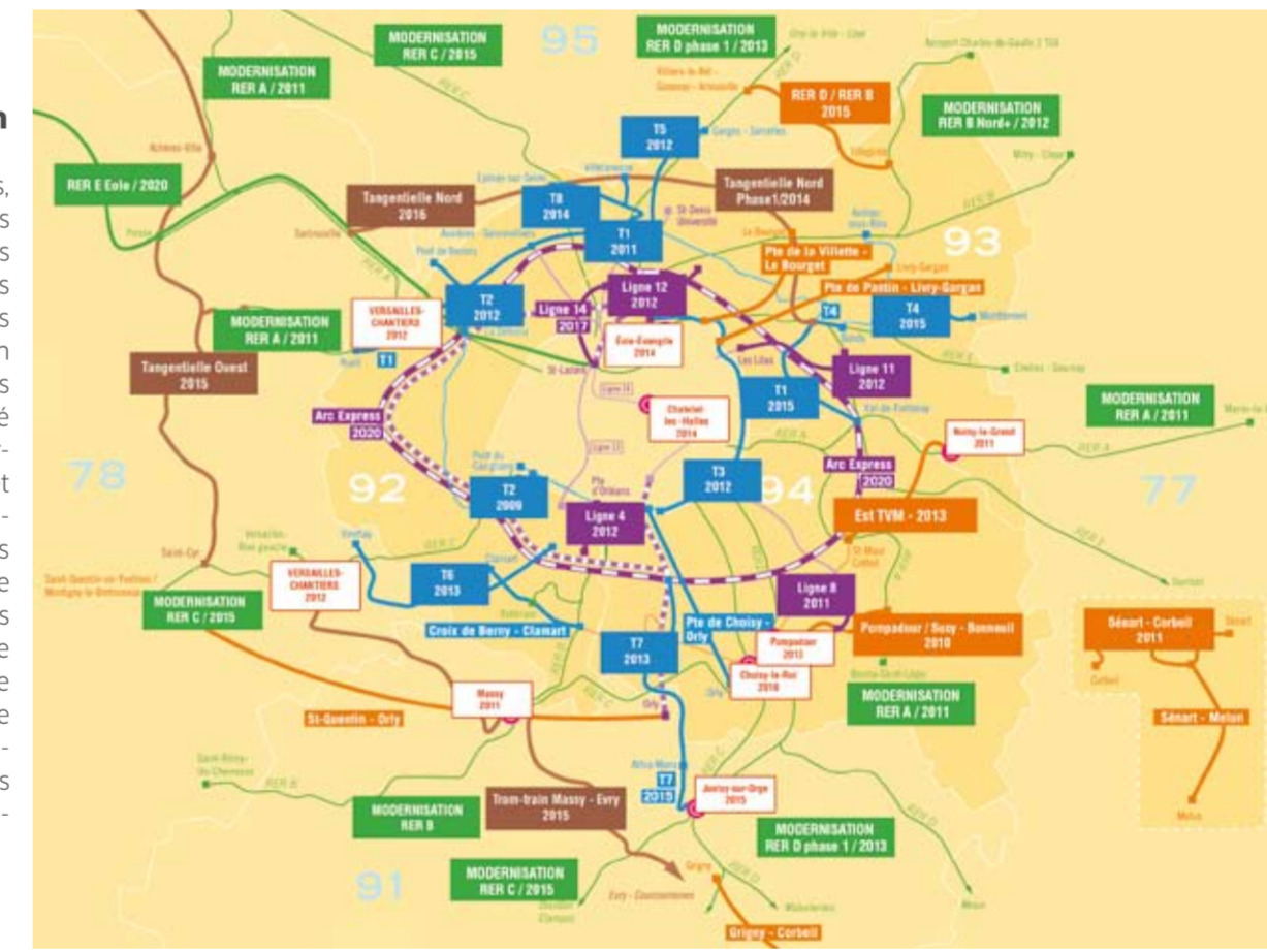
Plan de mobilisation pour les transports : des réalisations pour tous les Franciliens.

Avant tout, répondre aux besoins du quotidien : des services encore plus sûrs, plus réguliers et plus propres. Et, en même temps, préparer l'avenir : moderniser tous les RER, aussi bien les lignes que les trains, améliorer le système d'information des usagers, créer Arc express, une nouvelle rocade pour faciliter le transport de banlieue à banlieue, et rendre progressivement accessible tout le réseau. En plus, nous renforcerons les services de bus de nuit (Noctilien) et, le matin, nous avancerons les horaires pour les salariés qui travaillent