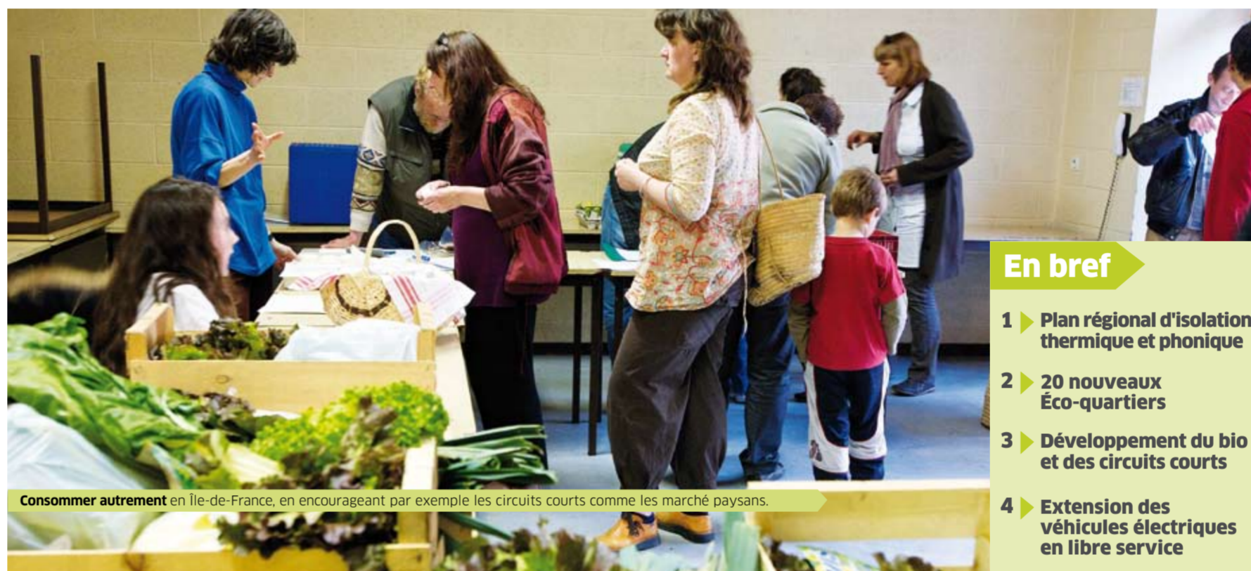
Consommer autrement en Île-de-France, en encourageant par exemple les circuits courts comme les marchés paysans.

lement un certain nombre de propositions concrètes. Nous étendrons l'offre de véhicules électriques en libre service en lien avec les parcs de stationnement relais et implanterons un réseau de bornes de rechargement des batteries. Nous augmenterons l'offre de vélos en libre service dans toute la région pour lesquels nous créerons des parcs de stationnement et d'entretien. Nous ferons une plus grande place au bio dans les cantines des lycées d'Île-de-France. Plus largement, nous financerons la distribution de produits bio ou issus du commerce équitable dans nos territoires : Amap, marchés bio, commerces... Nous créerons un Eco-Wikipédia de l'Île-de-France, portail Internet coopératif d'informations sur l'environnement et centre de ressources pour les acteurs du développement durable. Dans le même temps, nous lancerons des universités populaires écologiques pour les Franciliens, ateliers innovants des savoir-faire de l'environnement. Les éco-compagnons permettront aux Franciliens d'agir chaque jour, sur leur environnement, par des gestes simples et sur la base de diagnostics clairs.