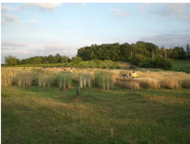
Fig. 17 – Un'altra veduta d'insieme del campo catalogo di cereali invernali

Gli agricoltori biologici sono i più interessati a riprendere le pratiche rurali di gestione delle sementi, cercando di rispondere alle richieste di cibi più sani prodotti in condizioni più rispettose dell'ambiente.