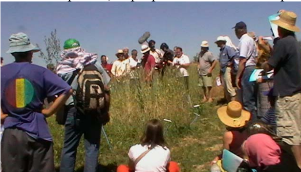
Fig. 1 – Al centro del campo catalogo, disposto come il paradiso terrestre, un ulivo e alcune specie indicative dell'evoluzione del frumento

Quasi tutti i convegni sono composti di pubblico che ascolta e di esperti specialisti, che spiegano qualcosa di quello che sanno. Caratteristica di quest'incontro è stato il fatto che tutti erano considerati degli esperti, i quali spiegavano agli altri, ma soprattutto dimostravano concretamente in laboratori pratici, le proprie conoscenze e capacità.