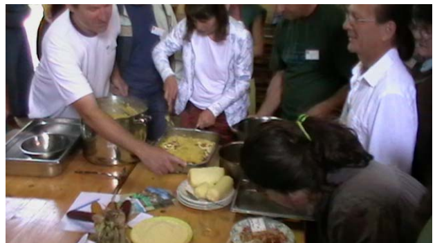
Fig. 10 – I Rumeni preparano la mamaliga con mais, cacio, lardo, cavoli locali