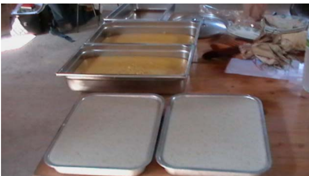
Fig. 9 – Ecco la polenta di Marano vicentino e quella di Bianco Perla, pronte da suddividere

Noi dell' Aveprobi (soci della Rete dei Semi Rurali ) eravamo stati invitati, come conservatori delle vecchie varietà venete di granoturco, ad illustrare le nostre preparazioni tipiche con il mais. Oltre alle due polente, che abbiamo cotto alla maniera veneta accanto ai Rumeni che hanno preparato la mamaliga (una specie di polenta pasticciata) e del pane con farina di mais, noi abbiamo anche presentato i tipici zaleti veneziani con farine di Marano e di frumento polonico ed un diverso formato di biscotti, gnocchetti, con farine di Biancoperla e di farro.