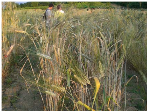
Fig. 20 – Fra le più belle varietà di frumento duro ci sono quelle attribuite alla specie T. polonicum o T. turgidum , fra cui le italiane Saragolla, che qui fa mostra di sé, Etrusco, Graziella, o la palestinese Nab al Jamal (canino di cammello)

Dai ripensamenti e dai commenti tra agricoltori, dopo la straordinaria esperienza vissuta nell'azienda dei Berthelot, risulterebbe che la pratica un tempo tradizionale di coltivare miscele di frumento nello stesso campo, anziché singole varietà omogenee, assicura una minore formazione di micotossine . È questo delle micotossine un problema sollevato da ricerche scientifiche piuttosto recenti ed attualmente molto sentito. Le ricerche agronomiche sull'argomento sono di regola indirizzate alle condizioni climatiche e all'epoca di semina, molto poco si indaga sull'eventuale resistenza di alcune varietà e tanto meno sulle consociazioni colturali e sulle miscele varietali , che sono pratiche pressoché abbandonate nell'agricoltura moderna.