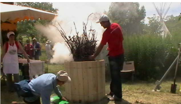
Fig. 3 – Riscaldamento del forno georgiano

Oltre al forno a legna della famiglia Berthelot, la cui attività principale è la coltivazione di centinaia di tipi di frumento (soprattutto di varietà rurali dimenticate) e la trasformazione in pane, era stato installato un forno a riscaldamento indiretto con due piattafornie girevoli. Inoltre, Siriani, Palestinesi, Iraniani, Giordani, Algerini, avevano costruito sul posto un forno arabo in terracotta, simile ad altro trasportato in tre pezzi dal gruppo di Georgiani e ricostruito isolandolo con argilla trattenuta da una specie di botte lignea.