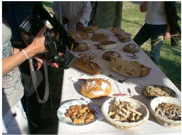
Fig. 8 – Il tavolo dei prodotti finiti. Dal primo piano, gnocchetti veneziani, tagliatelle e sedani toscani, pane di piccolo farro e khora, di segale tedesco, di segale svedese, di spelta belga, pane iraniano, zaleti, pane rumeno con mais e frumento, altro con mais e segale, francese alle spezie, georgiano, palestinese, maccheroni siriani, pane giordano, altro siriano, Knackebrot svedese

Noi dell' Aveprobi (soci della Rete dei Semi Rurali ) eravamo stati invitati, come conservatori delle vecchie varietà venete di granoturco, ad illustrare le nostre preparazioni tipiche con il mais. Oltre alle due polente, che abbiamo cotto alla maniera veneta accanto ai Rumeni che hanno preparato la mamaliga (una specie di polenta pasticciata) e del pane con farina di mais, noi abbiamo anche presentato i tipici zaleti veneziani con farine di Marano e di frumento polonico ed un diverso formato di biscotti, gnocchetti, con farine di Biancoperla e di farro.