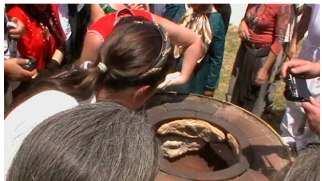
Fig. 4 – Cottura del pane georgiano