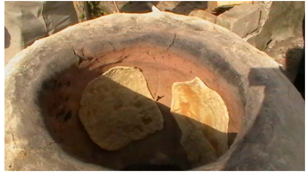
Fig. 6 – pane spiattellato nel forno di terra cotta