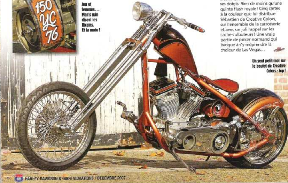
68 HARLEY-DAVIDSON & 6888 VIBRATIONS / DECEMBRE 2007

Un seul petit mot sur le boulot de Creative Colors : top !