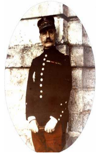
Ferdinand Foch (1851-1929)