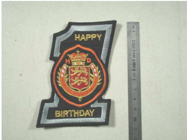
Un essai qui a fait jaser !