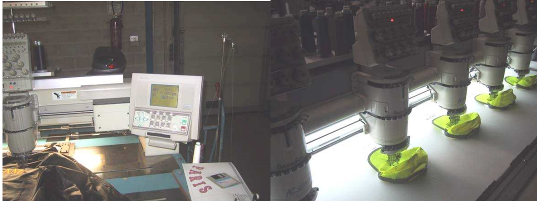
Broderie sur cuir ok !

Affilié à « Vallée de l'Eure Chapter Organisation » Association Loi 1901 - Fondée le 5 Avril 2002 - N° 0273009477