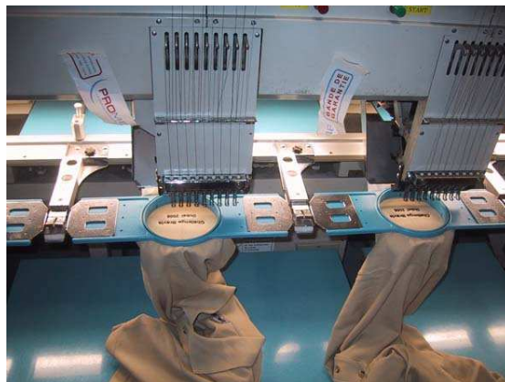
Un exemple de réalisation en cours

Ducs de Normandie Chapter 7 Rue Albert Einstein 76150 SAINT-JEAN DU CARDONNAY 02.76.30.62.90 ( Concession HD Légende 76 ) Courriel : bureau.ducs.normandy@free.fr Site http://www.ducsdenormandie.com Page 6 / 7