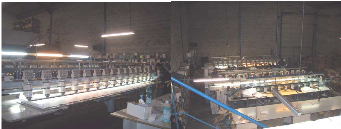
15 têtes the machine !!!