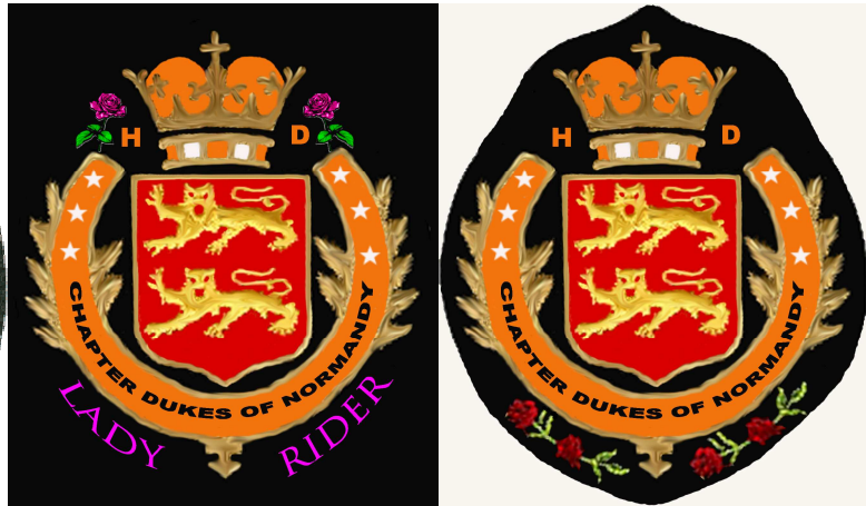
Et surtout ne pas oublier les Ladies ....

Ducs de Normandie Chapter 7 Rue Albert Einstein 76150 SAINT-JEAN DU CARDONNAY 02.76.30.62.90 ( Concession HD Légende 76 )