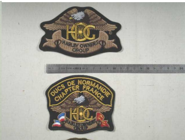
La broderie et ses détails techniques !