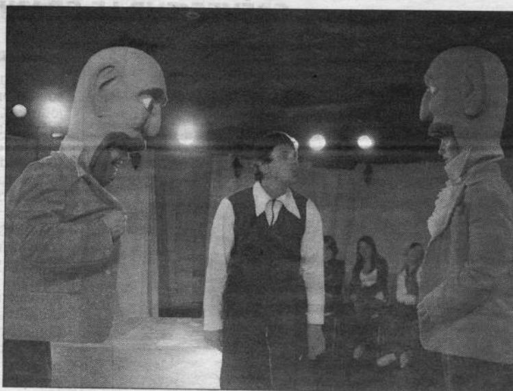
Des élèves de la Maison familiale rurale ont assisté au spectacle.