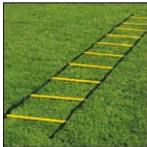
Pas-chassés entre les travers.