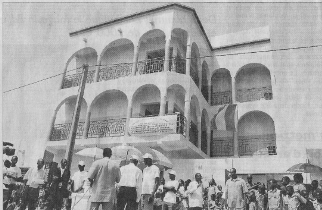
L'école Joseph Kézerbo (du nom d'un intellectuel panafricain burkinabé) qui accueille 450 élèves du primaire au collège, a été inaugurée le 2 novembre en présence du roi du reggae africain Tiken Ja Fakoly.

Inaugurée en grande pompe le 2 novembre dernier en présence de la grande star ivoirienne du reggae africain Tiken Ja Fakoly, ce « joyau architectural », comme aime à le définir son initiateur mosellan, est un « bâtiment bien orienté, bien ventilé, on y a pas trop chaud ».