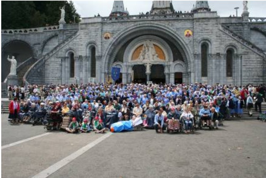
Le pèlerinage diocésain, vu par un photographe amateur ...