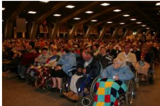
A St Pie X, sagement !

Avec quelques nouveaux pour terminer cet échantillon (à la demande un CD pourrait être fourni, avec l'ensemble des photos prises par les uns et les autres).