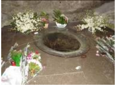
Le chemin de l'eau

Source de vie, de guérison, à Massabielle