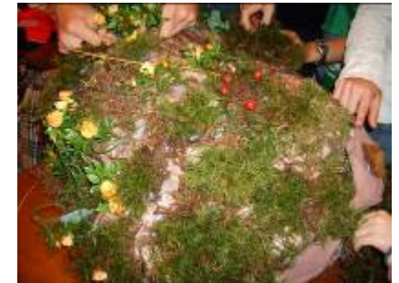
Au rocher fabriqué par les enfants