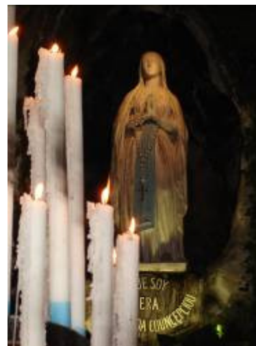
De la grotte