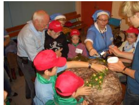
avec quelques complices ...

Nous sommes arrivés à l'engagement des hospitaliers et aux intentions déposées à l'intérieur, que nous découvrirons en 2008.