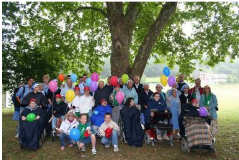
Sous l'arbre de Zachée (!), l'ensemble du groupe situé au 4 ème