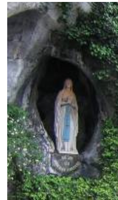
Du rocher de Massabielle