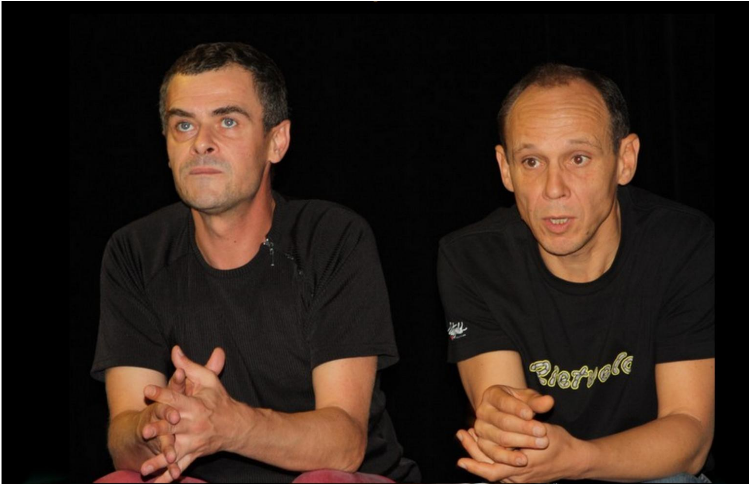
Silence complice, photos de répétition Daniel Keene