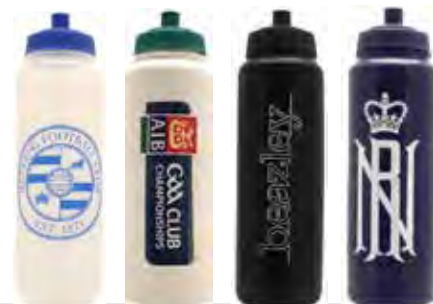
transparent blanc noir navy

1 Litre - Surface d'impression largeur 110mm x 150mm de hauteur