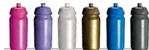
magenta 2665c perle Or 300c 424

500ml - Surface d'impression largeur 235,5 mm x 100mm de hauteur