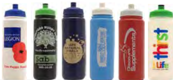
Blanc noir navy cyan rouge transparent

750ml - Surface d'impression : largeur 140mm x 130mm de hauteur