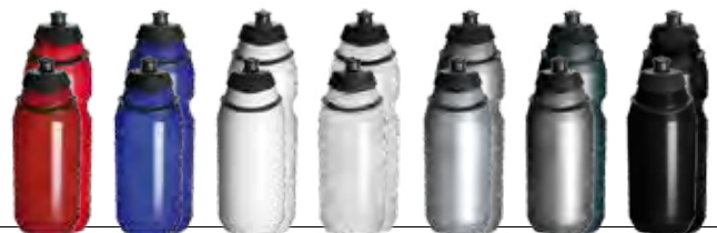
199c 2738c blanc transparent argent gris black

750ml - Surface d'impression : largeur 235,5mm x 100mm de hauteur