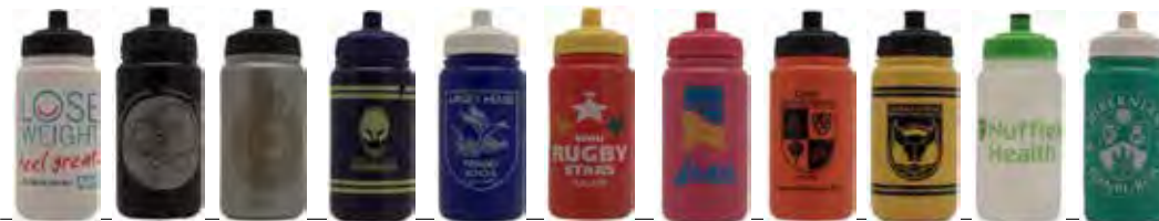
blanc noir argent Navy bleu rouge rose orange jaune transparent vert

500ml - Surface d'impression largeur 140mm x 85mm de hauteur