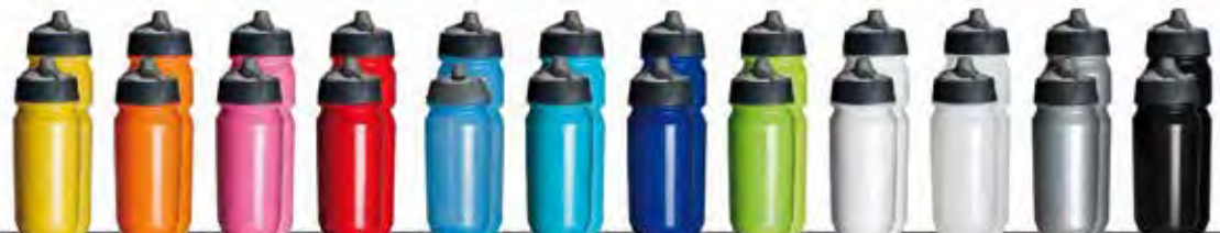
108c 151c 212c 485c 2915c 801c 287c 375c blanc transparent argent Noir

750ml - Surface d'impression : largeur 235,5mm x 100mm de hauteur