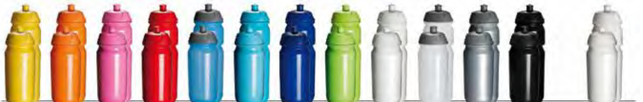
108c 151c 212c 485c 2915c 801c 287c 375c blanc transparent argent Noir Bio-Bottle blanche

750ml - Surface d'impression : largeur 235,5mm x 100mm de hauteur