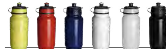
108c 485c 072c Blanc transparent Noir

500ml - Surface d'impression largeur 235,5 mm x 100mm de hauteur