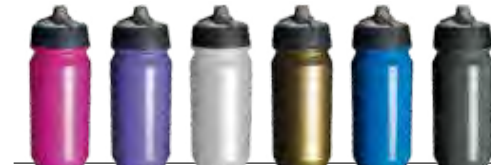
magenta 2665c perle Or 300c 424c

500ml - Surface d'impression largeur 235,5 mm x 100mm de hauteur