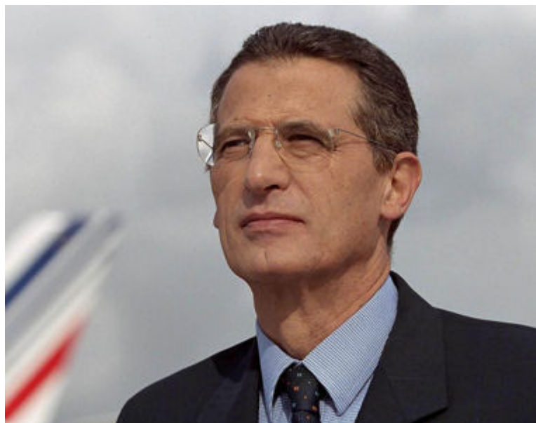
Jean-Cyril Spinetta

A la tête d'Air France depuis 10 ans, Jean-Cyril Spinetta bénéficie du régime particulier pour les cadres dirigeants de la compagnie aérienne. Ce système vise à accorder une retraite annuelle comprise entre 35 et 40 % de la moyenne des trois dernières années. Si Jean-Cyril Spinetta partait aujourd'hui, sa pension s'élèverait à 442.000 euros. Mais comme sa rémunération augmente d'année en année, ce montant va probablement continuer à croître.