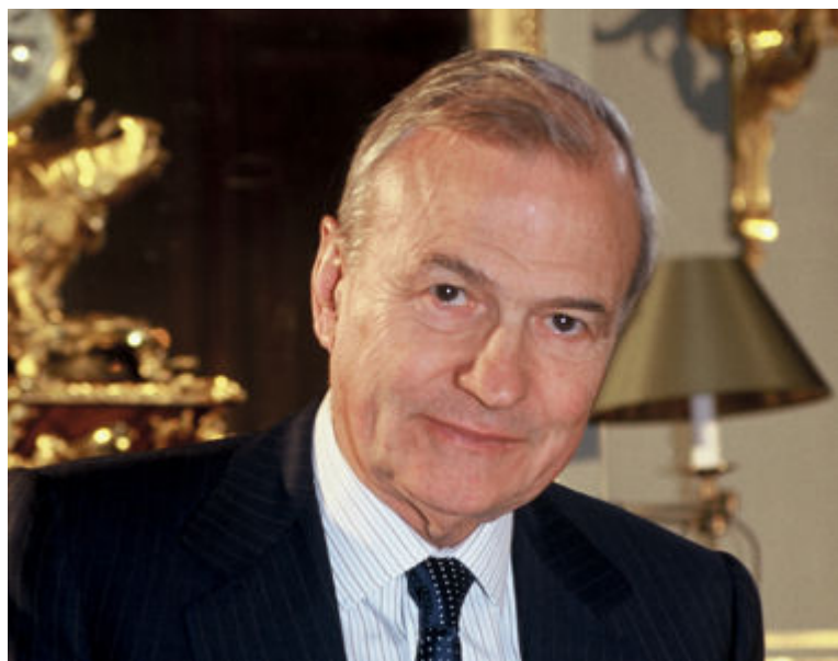
Claude Bébéar

Retraité de la compagnie d'assurance Axa, l'ancien PDG a perçu, en 2006, 433.766 euros au titre des engagements de retraite de la part d'Axa. La même année, celui qui occupe désormais la fonction de président du conseil de surveillance a gagné 123.500 euros de jetons de présence. Il possède en outre plus de 2,6 millions d'actions Axa.