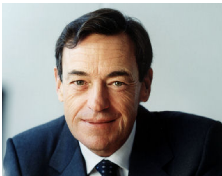
Lindsay Owen-Jones

Entré en 1969 chez L'Oréal, Lindsay Owen-Jones dispose d'une retraite record. Il avait cumulé 36 années d'ancienneté lorsqu'il a quitté ses fonctions, le 1er mai 2006.