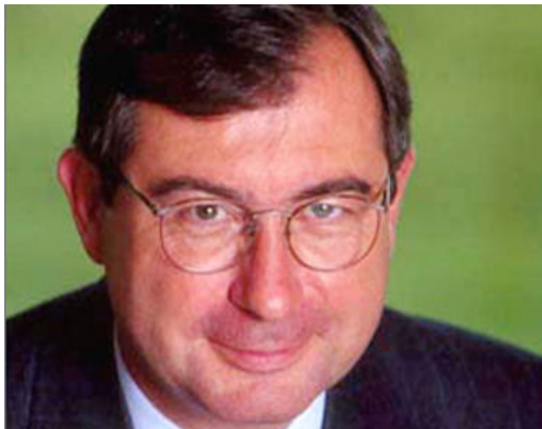
Martin Bouygues.

Si le fils du fondateur du groupe Bouygues a fait l'ensemble de sa carrière dans l'entreprises familiale, il n'est administrateur que depuis 1982. C'est seulement à partir de cette date que l'entreprise commence à cotiser pour le régime de retraite additive. Avec sa rémunération actuelle et un départ en retraite à 65 ans (en 2017), il aurait le droit à une pension de 740.000 euros par an.