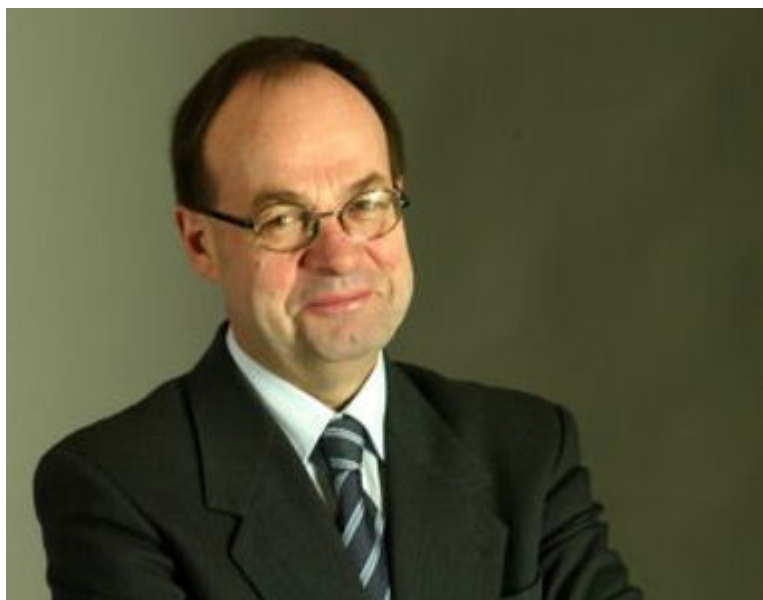
Jean-Martin Folz

Après 10 ans à la tête de PSA, Jean-Martin Folz est à la retraite depuis le 1er mars 2007. Il bénéficie désormais d'une convention d'assurance collective qui complète les systèmes obligatoires et conventionnels. Son montant maximal atteint 50% de la moyenne des trois meilleures rémunérations entre 2001 et 2006.