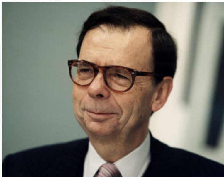
Louis Schweitzer

Même s'il n'est plus PDG de Renault, Louis Schweitzer ne perçoit pas encore sa retraite car il a pris les fonctions de président du conseil d'administration. En plus d'une indemnité forfaitaire de 200.000 euros, il reçoit de la part du constructeur automobile une rémunération fixe de 900.000 euros destinée à compenser l'absence de versement de sa pension.