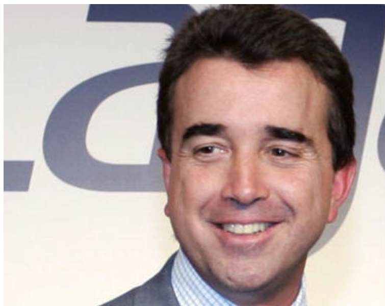
Arnaud Lagardère

Comme l'ensemble des membres du comité exécutif du groupe éponyme, Arnaud Lagardère bénéficie d'un régime de retraite supplémentaire. S'il prend sa retraite à 65 ans, il aura dépassé la limite maximale de cotisation fixée à 20 ans. Il pourra alors toucher 560.000 euros de retraite par an. Cette somme va cependant être revalorisée au fil des années.