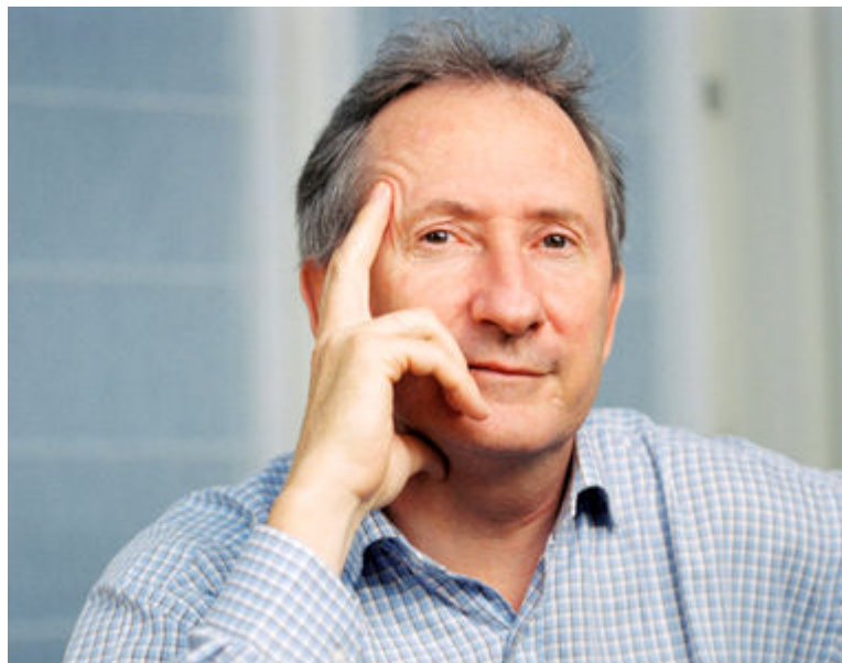
Franck Riboud

Le fils du fondateur de Danone est entré à 26 ans dans le groupe qui s'appelait alors BSN. PDG depuis 1996, il bénéficie, comme l'ensemble de la direction, d'un régime de retraite maison. Mais la rente qui lui sera versée lorsqu'il prendra sa retraite sera plafonnée à 35% des derniers salaires. Dans l'hypothèse où ses revenus n'évolueraient pas, il percevrait une retraite de 1,6 million d'euros par an.