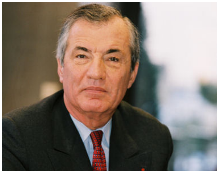
Bertrand Collomb

Le tout jeune retraité de la présidence de Lafarge perçoit une retraite complémentaire légèrement supérieure à 1 million d'euros par an. Même s'il est très élevé, ce montant correspond pourtant à un plafond. Sans cela, l'ancien patron du groupe cimentier aurait pu prétendre à une retraite de près de 1,5 million d'euros par an.