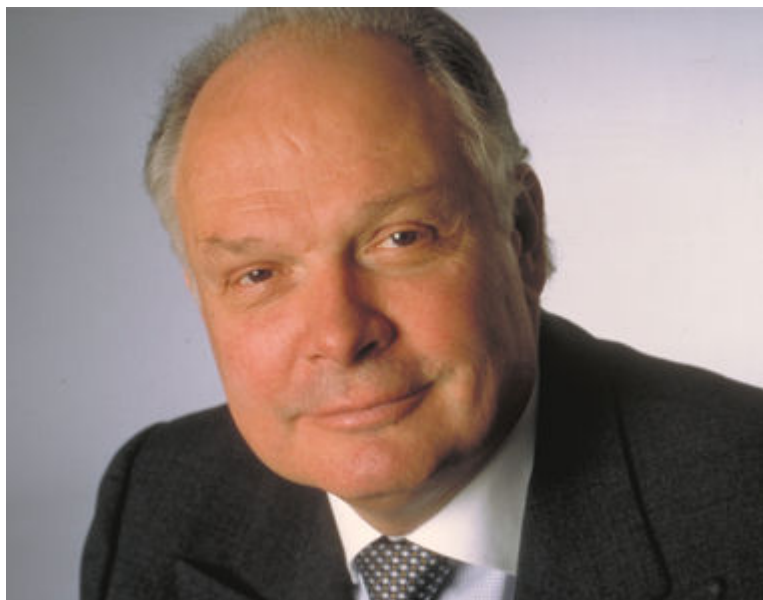
Bruno Bich

PDG du groupe Bic pendant 13 ans, Bruno Bich a pris sa retraite en avril 2006. Depuis, il bénéficie d'une pension versée par le régime complémentaire de retraite des cadres de direction de la société. Pour les neuf derniers mois de l'année, il a perçu 335.035 euros , ce qui monte sa pension annuelle à 446.714 euros.