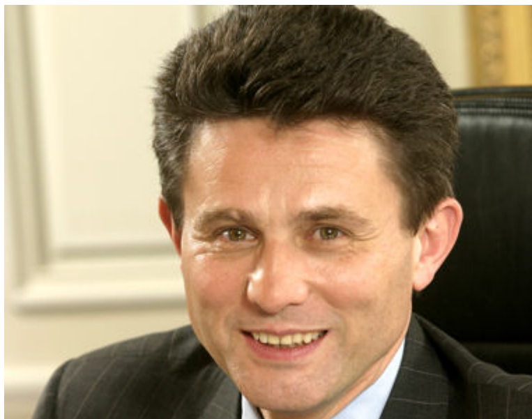
Henri de Castries

Etre l'un des patrons les mieux payés du Cac 40 assure de pouvoir bénéficier d'une retraite plus que confortable. Entré en 1989 dans l'entreprise, Henri de Castries aura normalement au moins 20 années d'ancienneté en tant que cadre dirigeant d'Axa lorsqu'il prendra sa retraite. Du coup, sa pension atteindra 40 % de la rémunération moyenne des cinq dernières années. En se basant sur la situation actuelle, Henri de Castries toucherait une retraite de près de 1,2 million d'euros par an.