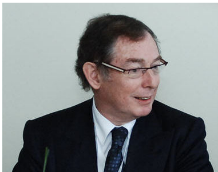
Noël Forgeard

Son licenciement en juillet 2007 a fait grand bruit et ses 8,6 millions d'euros d'indemnités ont soulevé un tollé. Mais après 8 ans passés dans les instances dirigeantes du groupe EADS, Noël Forgeard a aussi ouvert des droits à un régime de retraite complémentaire. Agé de 60 ans, il bénéficie donc d'une pension égale à 50% de son salaire annuel . Elle s'élève donc à 1,1 million d'euros par an.