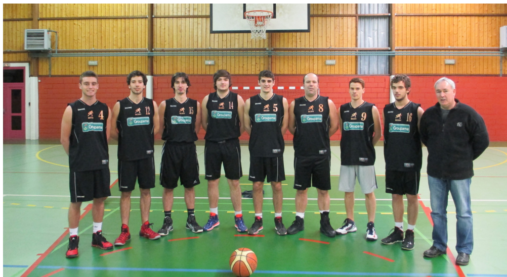
L'équipe première du BCBH évolue en Régionale 2

Est-ce que l'accession a attiré des supporters ou crée une émulation dans le bassin ?