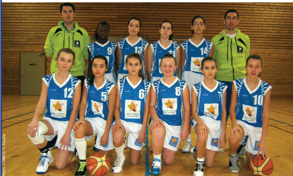
La sélection d'Aveyron U13 lors du TIC à Rodez la saison dernière

Les sélections d'Aveyron U13 ont démarré le dimanche 10 novembre. Pour cette première matinée de pré-sélection, les jeunes U13 étaient répartis en trois secteurs géographiques : Rieupeyroux, Berges du Lot et Olemps, afin de limiter les déplacements des parents et entraîneurs. Cette génération (joueurs et joueuses nés en 2001) participera au Tournoi Inter Comité (TIC) les 3, 4 et 5 janvier 2014 à Rodez. Les jeunes aveyronnaises seront encadrées par Serge Villanova, tandis que Hakim Bouhouicha s'occupera des garçons. Espérons que le travail qui sera fourni lors des cinq matinées de rassemblement permettra de faire briller les couleurs aveyronnaises.