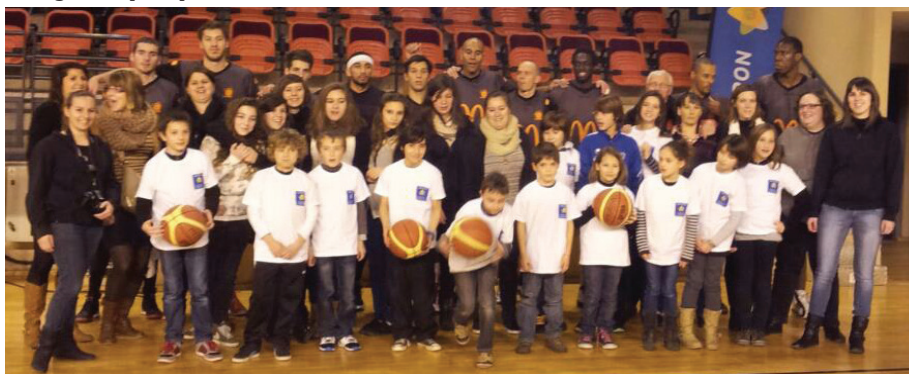
Le club d'Entraygues lors d'un match du SRAB l'an dernier

A l'heure où le comité départemental inaugure un championnat « Loisir » comment s'envisage l'avenir du basket entrayguois ? « Nous prendrons la décision en fin de saison. Il est vrai que les résultats ne sont pas là mais affronter des équipes de D2 avec un niveau supérieur nous fait vite progresser et nous apprend à jouer ensemble ». Quid d'une équipe séniors garçons ? « Il n'y aura pas de création d'une équipe séniors garçons qui sont davantage tournés vers le foot ». Quoi qu'il en soit le basket et les sports de salle en général ont leur place sur le territoire nord aveyronnais comme l'avaient prouvé il y a quelques années les volleyeurs du Carladez en montant en Nationale 1. C'est tout le mal que l'on souhaite aux Basket Club Entraygues.