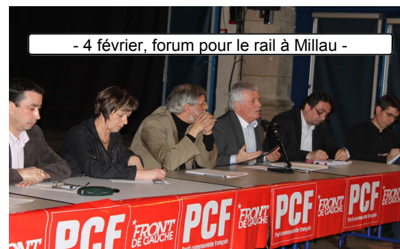
- 4 février, forum pour le rail à Millau -

CONCRETEMENT, l'acte officiel de naissance de cette coordination devrait avoir lieu en juin (2 ème quinzaine) dans le cadre d'un soutien à une manifestation nationale des cheminots. Un rendez-vous important sera donné à la fête de l'Humanité, tandis qu'un rassemblement national d'ampleur est envisagé pour cet automne.