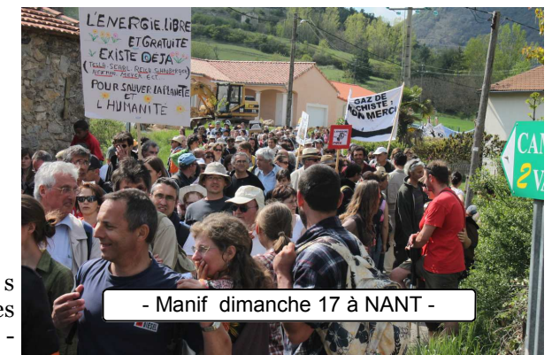
- Manif dimanche 17 à NANT -

Les questions énergétiques posent aujourd'hui de grands enjeux de civilisations. Certaines ressources, comme le pétrole, s'épuisent. D'autres, font courir des