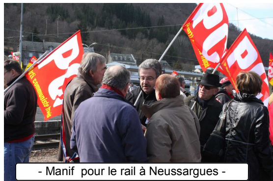
- Manif pour le rail à Neussargues -