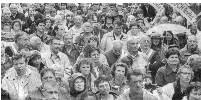
Mobilisation pour l'hôpital de Decazeville

Les élus du P.C.F avec leurs camarades du P.G., de la Gauche Unitaire de Paris, du Pas-de-Calais ont proposé la tenue d'assises régionales de la santé. D'autres régions pourraient suivre.