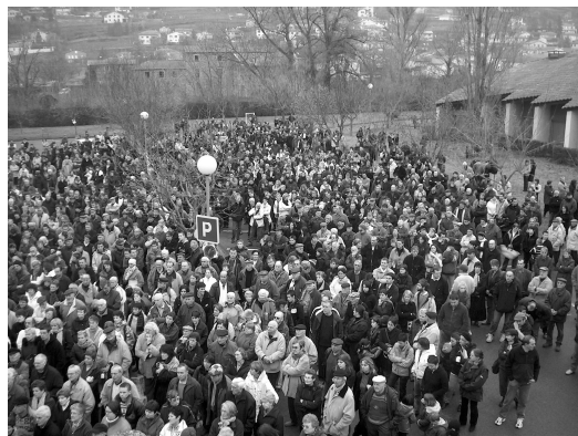
Manif à Saint-Affrique pour la défense de l'hôpital