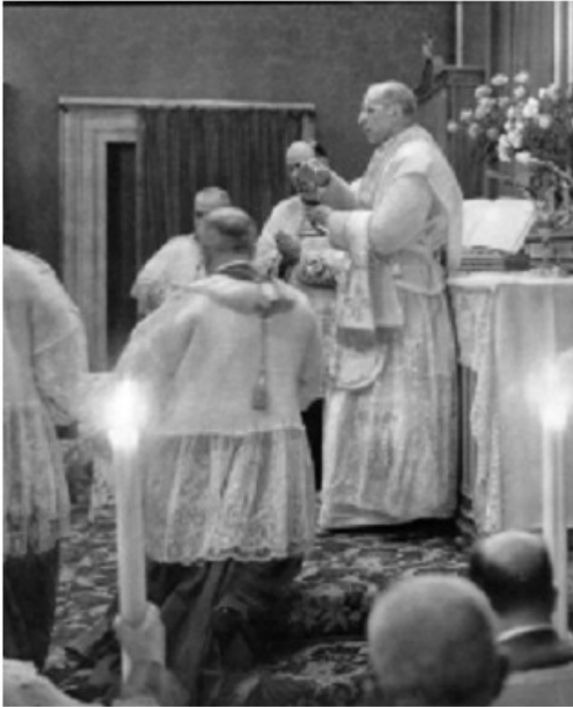
Pie XII célébrant la Sainte Messe

circulent pour justifier les sacres, tout cela peut remplir l'esprit d'inquiétude et d'angoisse..." (54).