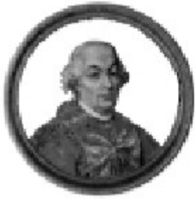
Le Pape Pie VI

dans son article; je renvoie à ce propos à ce que j'ai déjà écrit dans Sodalitium (n° 28, p.4), et je m'excuse de devoir me répéter.