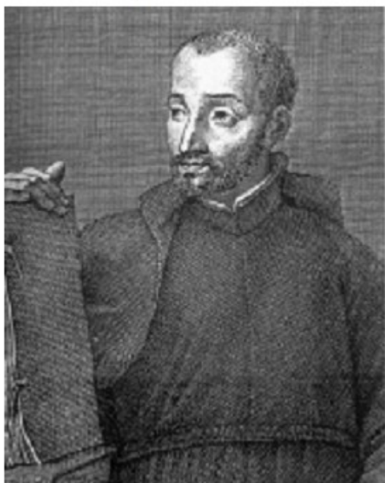
Le Père Laynez, Général des Jésuites