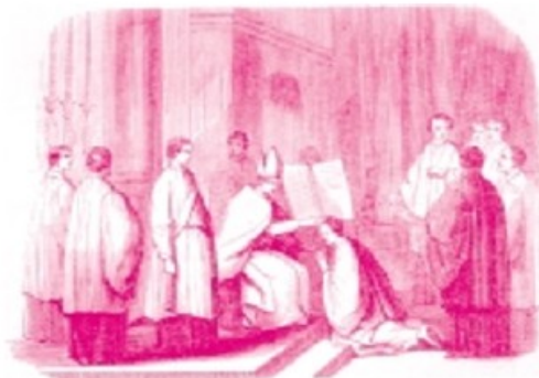
Evêque imposant les mains

Après trois pages du P. Héris, B. expose sa thèse en cinq lignes; je vais les citer (sans pouvoir m'empêcher d'y glisser déjà quelque commentaire entre crochets): "cette longue citation [du P. Héris] affirme bien la nature essentiellement hiérarchique du pouvoir épiscopal, tel qu'il est donné par la consécration elle-même [ratione ordinis, concedo; ratione jurisdictionis, nego]: c'est une régence sur le corps mystique, c'est un pouvoir princier [Héris distingue: 'on divise d'ordinaire le pouvoir de régence de l'évêque en pouvoir d'ordre et en pouvoir de juridiction...'] (11). La juridiction est distincte, et ne peut venir que du Pape [c'est ce que B. niait et maintenant, Dieu merci, admet] mais elle en est un complément in-