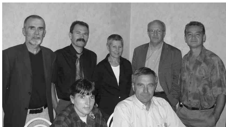
L'équipe « Pour Dompierre », toujours présente sur le terrain, prépare son bilan et sa prochaine réunion publique d'automne. Elle a le plaisir de présenter ce numéro 11 de sa lettre d'information.

Une partie de notre bilan fera bien évidemment ressortir aussi un peu le bilan de la municipalité en place. Nous l'avons dit, sur un certain nombre de points, nous considérons que la municipalité n'apporte pas les bonnes réponses : c'est particulièrement vrai sur les questions intercommunales, nous y revenons régulièrement, et nous y reviendrons autant qu'il le faudra ; c'est vrai aussi sur la Poste, nous nous exprimons à ce sujet en page 2 ; c'est enfin vrai également sur les services à la population, sur les problèmes d'aménagement et de circulation, questions qui devraient