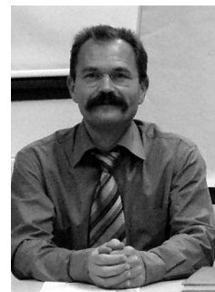
Par Philippe GABORIAU animateur de l'équipe