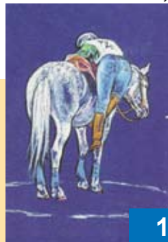
Illustration V. de Saint-Vaulry

Droits de reproduction et d'adaptation réservés pour tous pays.