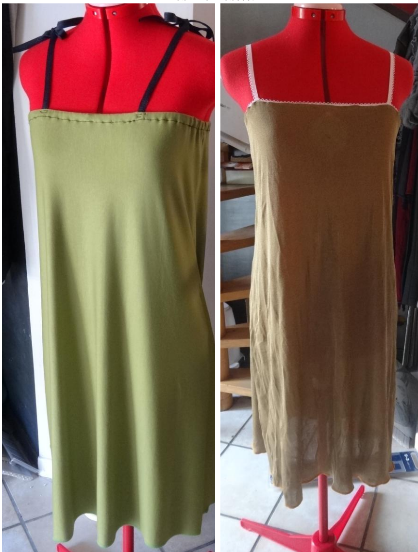
Sous robe à gauche