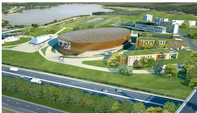
Image de synthèse du Vélodrome de Saint-Quentin en Yvelines (2013)