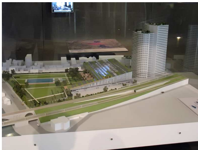
Maquette du Centre Aquatique Olympique d'Aubervilliers (2012)