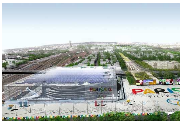
Le « Super-Dôme », lieu prévu pour la gymnastique