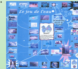
Le jeu de l'eau