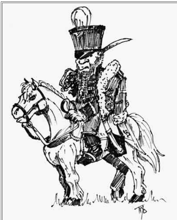
Hussard Nain - Horde Noire de Brewswick.