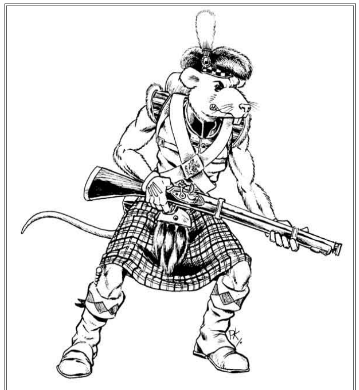
Rat des Highlands de Joccia - Infanterie de Ligne.

Les joueurs doivent bien faire attention à propos de leur choix dans l'ordre de résolution des déplacements. Certains voudront d'abord voir ce que vont faire leurs adversaires ; Si tel est leur choix, ils devront assumer les conséquences de leur décision. Cela signifie que si vous choisissez « d'attendre pour voir » et si votre adversaire se déplace en premier et engage certains de vos « hommes » au corps à corps, ILS NE POURRONT PAS SE DÉPLACER CE TOUR CI ayant étaient engagés au corps à corps, de plus ils DOIVENT combattre en mêlée au moins pendant un Tour de Jeu.