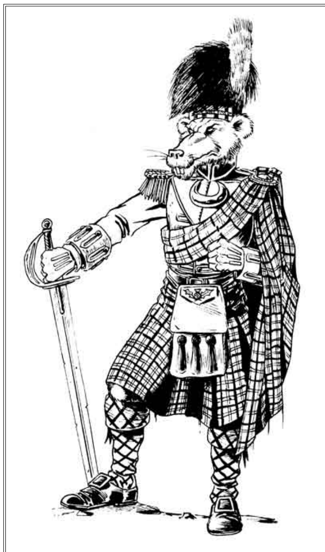
Le Capitaine Angus McBam - 44th Strathcarnage & Killmore Highlanders.

La taille de certaines armes ne permet pas à tous les combattants de pouvoir les porter et encore moins de pouvoir tirer avec ! Par exemple seuls les Orques des Marais, Ogres ou Trolka sont suffisamment forts pour porter et surtout faire feu avec un Kannonderbuss... Quant aux Halfings aucune arme à feu n'est adaptée à leur petite taille !