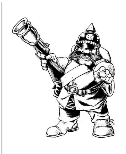
Nain de la Garde – Krautia.

La liste détaillée des compétences et leurs effets en jeu se trouve dans la version complète des règles de Flintloque.