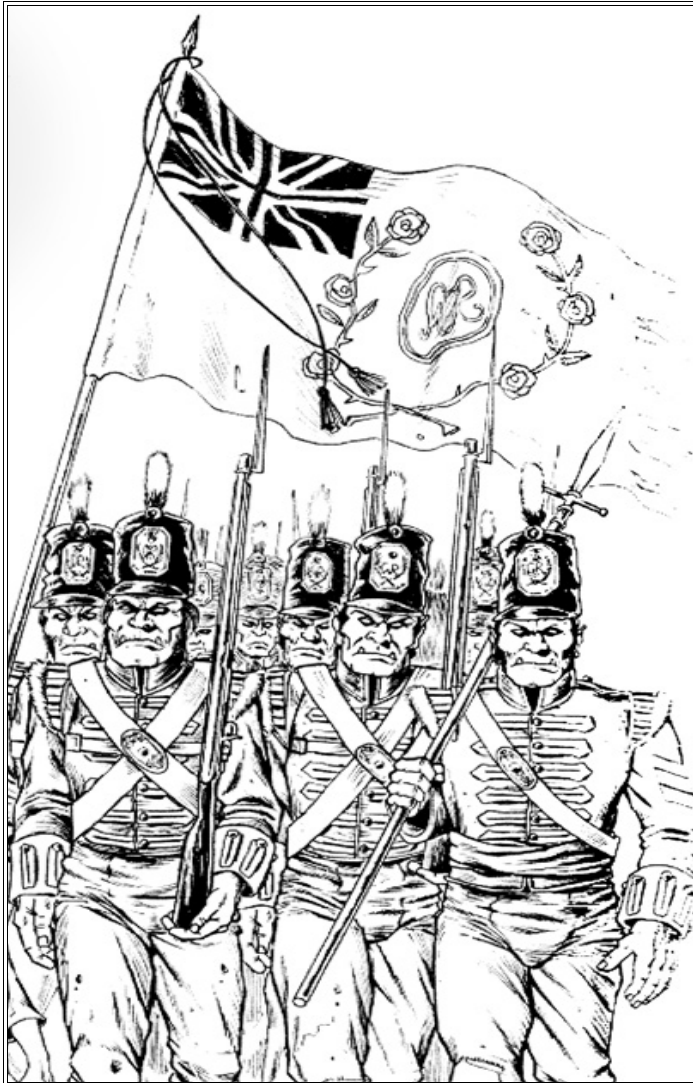
Orques d'Albion - Régiment d'Infanterie.

Pour motiver un combattant Mort-vivant, une Liche lui inflige 1 Blessure (sans Test de Moral !), le combattant réprimandé peut alors continuer d'agir normalement. La Liche n'a pas de limitation de portée pour faire cela, tant qu'elle est en jeu elle a la capacité de le faire sur toute la table. La Liche ne peut pas accomplir d'autre Action durant le tour où elle utilise ce pouvoir, hormi un Mouvement.