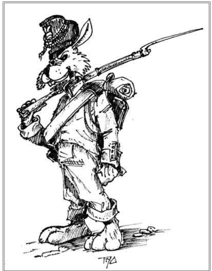
Lapin de la République de Burrovia - Infanterie de Ligne.

Seuls les combattants montés, ou cavaliers, peuvent annoncer une Charge. La procédure d'une Charge est détaillée dans la section consacrée à la Phase de Charge, un peu plus loin. Les charges inscrites sur la Feuille d'Ordres doivent clairement être déclarées avant la Phase de Moral du Tour dans lequel elles vont avoir lieu.